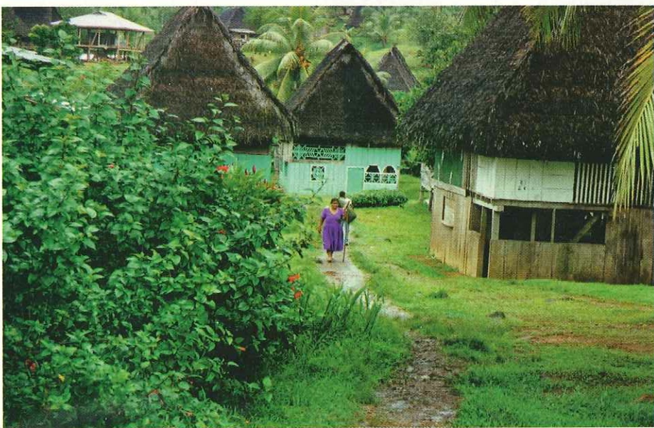
La comunidad Ngöbe posee una fuerte identidad cultural ligada a una conciencia sobre la conservación y el buen manejo de los recursos naturales.

fermentado y secado) y luego se vende en Almirante. La mayoría del producto se vende a la Cooperativa de Cacao Bocatoreña (COCABO) y se comercia como un producto orgánico, logrando un beneficio adicional de al menos 30% del precio de cacao convencional.