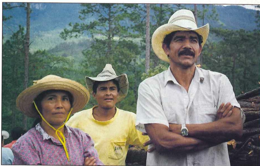
PLANFOR promoverá la integración de los gobiernos locales, las comunidades y los habitantes rurales a los beneficios del bosque.

El beneficio del PLANFOR estará asegurado en la medida en