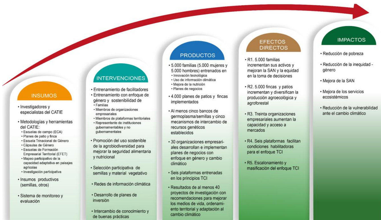
Figura 2. Ruta de impacto de MAP-Noruega

La ruta de impacto de MAP-Noruega (Figura 2). Fue creada con base en una teoría de cambio que describe cómo los productos desarrollados y usados en el marco de MAP-Noruega permitirán alcanzar los efectos directos identificados en el marco lógico del programa y, eventualmente, contribuir a lograr un impacto positivo en los medios de vida. Esta ruta de impacto fue, además, la guía para crear el sistema de monitoreo del programa.