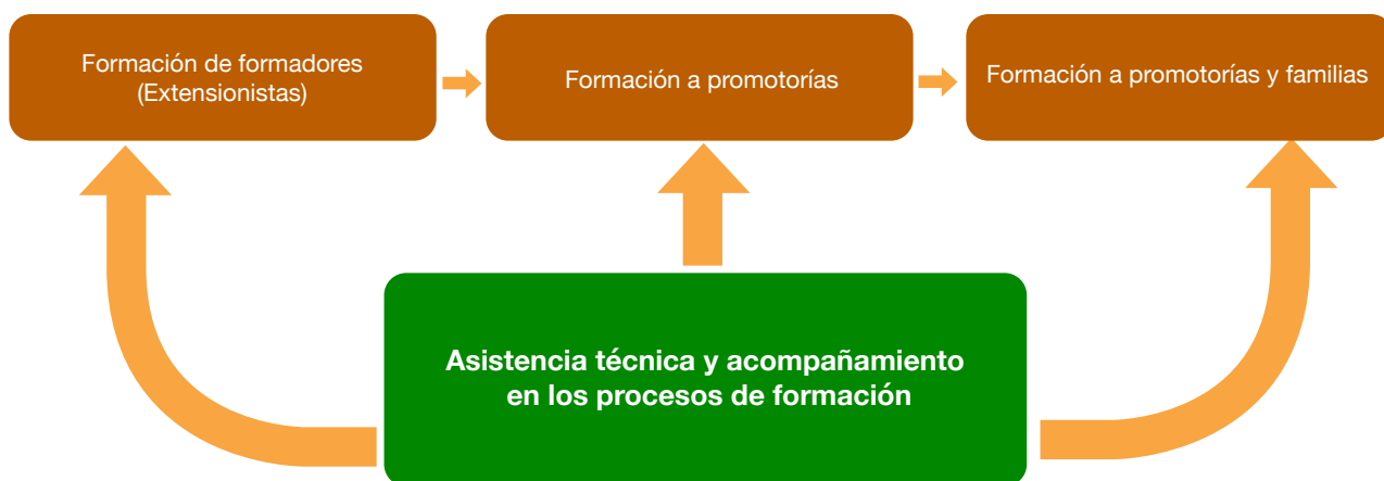
Figura 6. Desarrollo del programa de gestión del conocimiento en el marco del SNER

Como miembro del SNER, el proyecto CATIE-MAGA-NORUEGA promovió el fortalecimiento del conocimiento local, el desarrollo de las habilidades y destrezas de las familias que conforman los CADER, así como la formación de promotorías comunitarias y la formación y actualización de los conocimientos de los y las extensionistas de las AME. La Figura 6 muestra de forma gráfica este proceso.