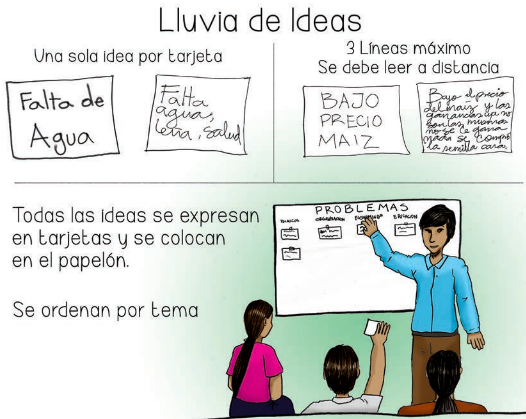
Figura 1. Técnica de diálogo conocida como lluvia de ideas