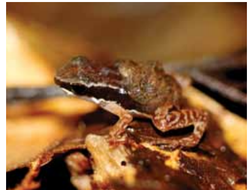
Colostethus pratti. Esta rana habita bosques y cacaotales. Suele verse en sitios rocosos cercanos a los arroyos. Se reproduce en la hojarasca.