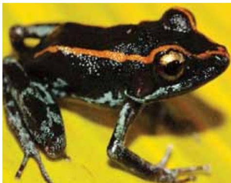
Pristimantis gaigeae. Esta rana habita los bosques y cacaotales. Los adultos suelen verse en la hojarasca del suelo y frecuentan pequeñas cuevas rocosas. Se reproducen en la hojarasca.