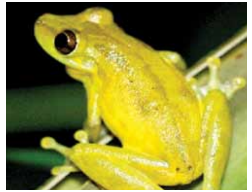
Scinax elaeochrous. Esta rana habita cacaotales con manejo. Suele verse sobre las hojas y los árboles. Se reproduce en estanques temporales de agua.