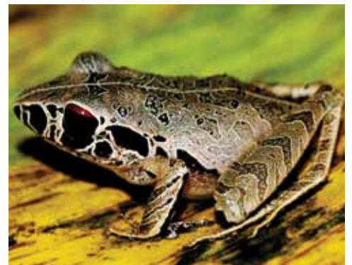
Craugastor gollmeri. Este sapo habita bosques y suelen esconderse bajo la hojarasca en donde deposita los huevos.