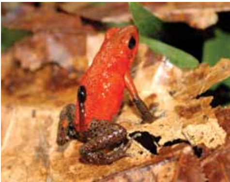
Oophaga pumilio. Esta rana roja venenosa habita bosques y cacaotales con y sin manejo. Se reproduce en la hojarasca. Cambia en una amplia gama de colores.