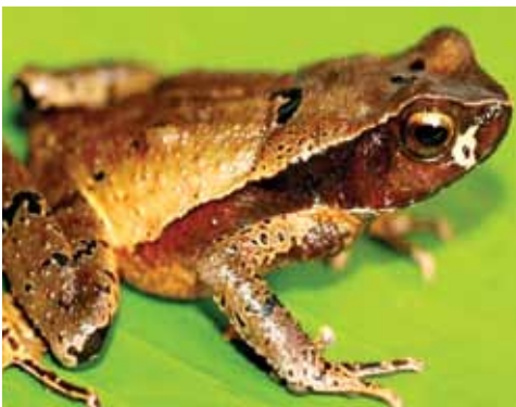
Rhaebo haematiticus. Este sapo habita el bosque y cacaotales. Los jóvenes suelen verse a lo largo de las quebradas bajo las rocas. Prefiere los estanques en sitios rocosos para reproducirse.