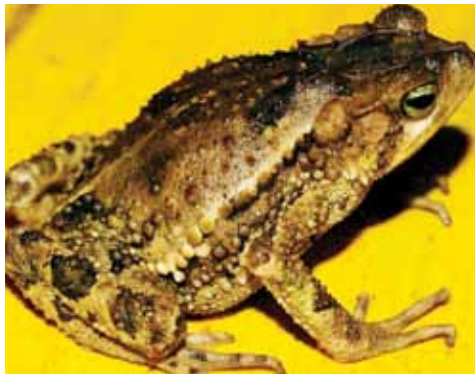
Cranopsis conifera. Este sapo habita en cacaotales con poco manejo. Puede verse encima del suelo sobre arbustos. Se reproduce en estanques.