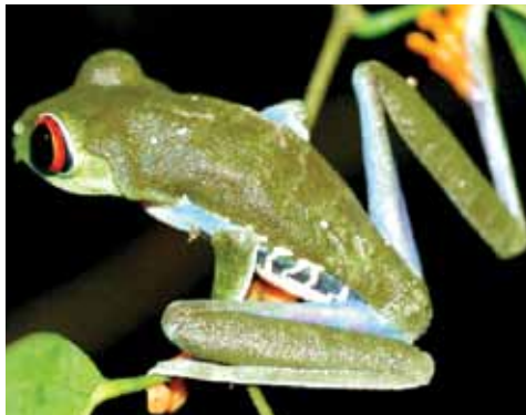
Agalychnis callydrias o rana de ojos rojos. Esta rana habita bosques y cacaotales. Se reproduce en estanques temporales o en pequeñas lagunas.