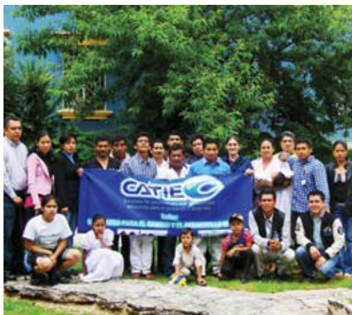
Participantes del taller de liderazgo en Chiapas.

Para la actividad se preparó un manual, el cual fue utilizado por 23 líderes comunales y técnicos locales asistentes, previamente seleccionados por su destacada trayectoria, tanto en el accionar de sus comunidades