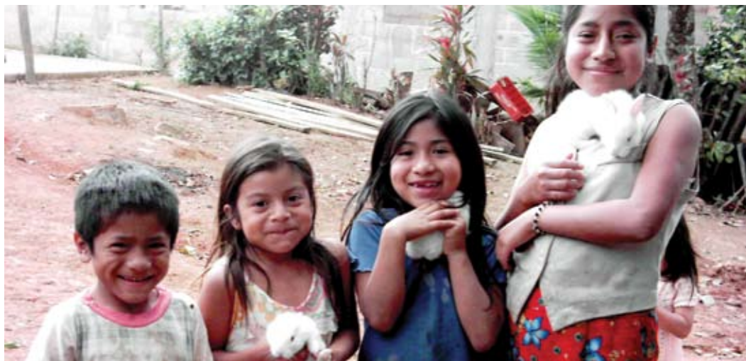
Niños de la comunidad de Tierra Nueva en Ocozocoautla, Chiapas.

Las tesis que realizan estudiantes de varias nacionalidades de la Escuela de Posgrado del CATIE (Centro Agronómico Tropical de Investigación y Enseñanza) en México muestran los resultados del aprendizaje, la experiencia y el contacto directo de los estudiantes con los productores y las comunidades rurales.