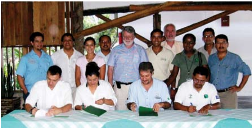
Firma del acuerdo entre el jefe de la Misión de Evaluación de KfW y los representantes de CONAP-Guatemala, SEMARNAT/CONANP-México y el Departamento Forestal de Belice, en representación del Ministerio de Recursos Naturales y Medio Ambiente de Belice.