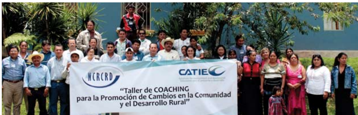
Participantes del taller de coaching en Chiapas.

Mediante charlas motivacionales, seminarios, talleres y otros, el coaching —un método que consiste en dirigir, instruir y entrenar a las personas para conseguir alguna meta o desarrollar habilidades específicas—se ha aplicado a diversos ámbitos de estudio.