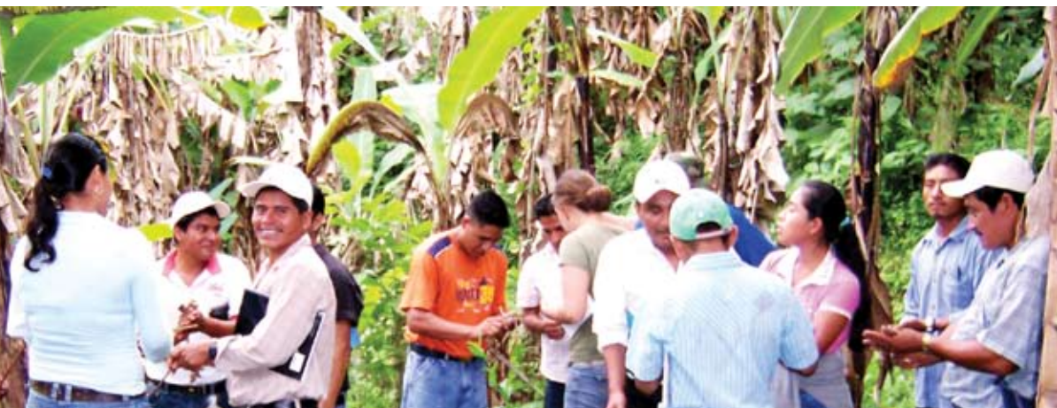
Capacitación de productores.

E n 2008, el CATIE (Centro Agronómico Tropical de Investigación y Enseñanza) estableció el Programa Agroambiental Mesoamericano (MAP, Mesoamerican Agroenvironmental Program), una ambiciosa plataforma intersectorial de conocimiento e innovación, con la meta de lograr el manejo y uso sostenible de la tierra, mejorando el bienestar humano en las áreas rurales de Mesoamérica.