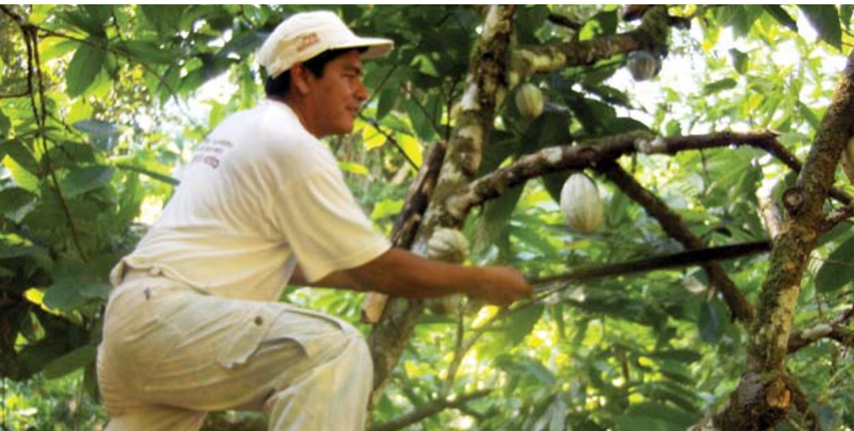
Poda de árboles de cacao.