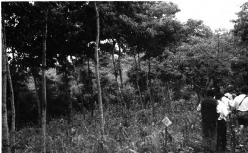
Gira de campo de la Red Agroforestal

La Red Agroforestal tiene como objetivos: la priorización de la capacitación en base a la consulta de sus integrantes, la formación de un grupo de capacitadores nacionales en temas agroforestales, el intercambio de experiencias, la comunicación entre sus integrantes, así como, con otras Redes que operan en el país relacionados con el tema de los recursos naturales.