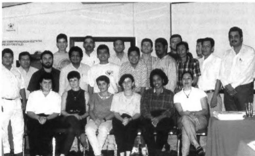
Actividad de Capacitación de la Red de Semillas Forestales.

A esta Red pertenecen actualmente 22 instituciones.