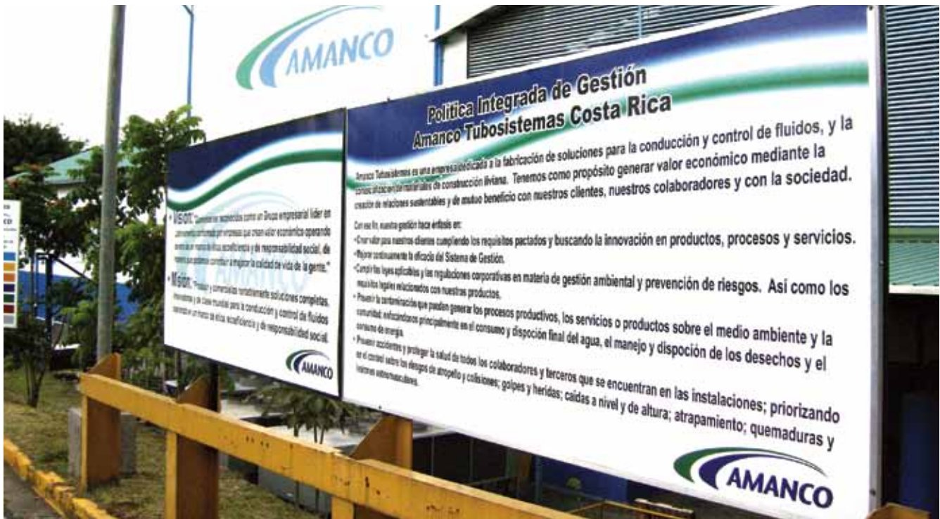
Para la empresa privada, la responsabilidad social y ambiental es una inversión estratégica y una oportunidad para desarrollar relaciones ganar-ganar

mayoría de las empresas entrevistadas tienen clara su responsabilidad ambiental y social como un factor que puede afectar sus negocios y que, bien manejada, puede resultar en un beneficio o éxito. Algunas empresas incorporan el componente ambiental como un elemento fundamental de su gestión y cumplen con las normas vigentes de manera rutinaria; más aún, varias de ellas han incorporado normas más exigentes que las establecidas en el marco legal.