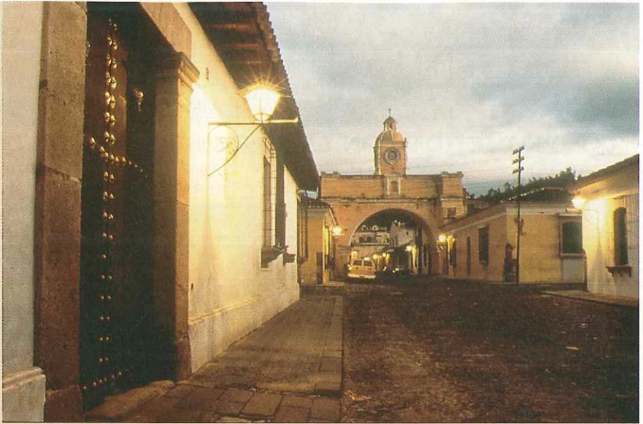
Santa Catalina, Antigua, Guatemala.

TODOS LOS PAÍSES de la región centroamericana son miembros de la Convención del Patrimonio Mundial, habiéndose designado como Patrimonio Mundial los siguientes lugares: