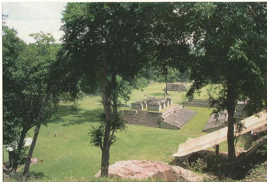
Sitio Maya de Copán, Honduras..