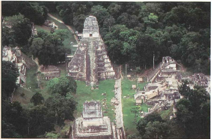
Parque Nacional Tikal, Guatemala.

SE TRATA DE IDENTIFICAR entre las riquezas culturales y naturales de cada país, los elementos cuya conservación interesa al conjunto de