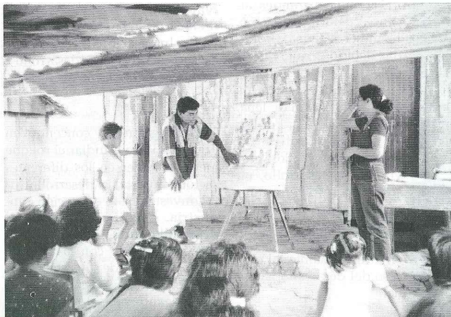
Participantes del Proyecto Mujer y Desarrollo Forestal analizan su situación cotidiana utilizando dibujos para iniciar la discusión.