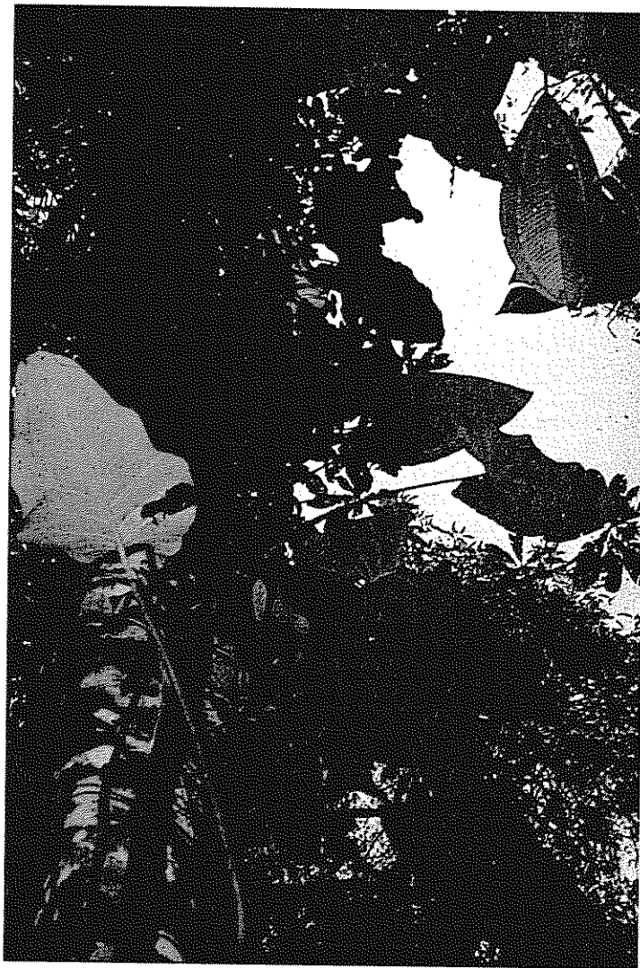
El Gobierno de Costa Rica empezó a generar "Bonos de Carbono", con el apoyo del Banco Mundial y el Consejo de la Tierra de las Naciones Unidas.

almacenada durante un año específico (3) se calcula acumulando la diferencia entre las columnas 1 y 2 a través del tiempo. Debido a las grandes áreas plantadas en años recientes y al hecho de que el carbono que fue secuestrado durante los periodos previos se ha venido acumulando, la cantidad neta de carbono almacenado ha crecido significativamente durante los últimos años, alcanzando casi 6,3 millones de t métricas en 1997 (5,2 millo-