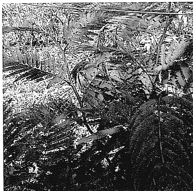
Las mezclas con C. calothyrsus mejoraron la eficiencia de utilización del N absorbido y la excreción de N en las heces de toretes