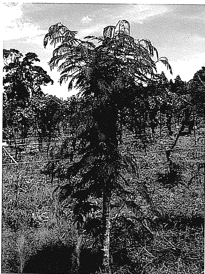
Calliandra calothyrsus contiene muchos fenoles y taninos condensados que reducen la digestibilidad de la materia seca

sa ofrecida representó 25% de la materia seca (MS) de la dieta. Se utilizó un diseño de cuadrado Latino de sobrecambio sin período extra (Lucas, 1983); cada período duró 15 días (10 de adaptación y 5 para colección de datos).