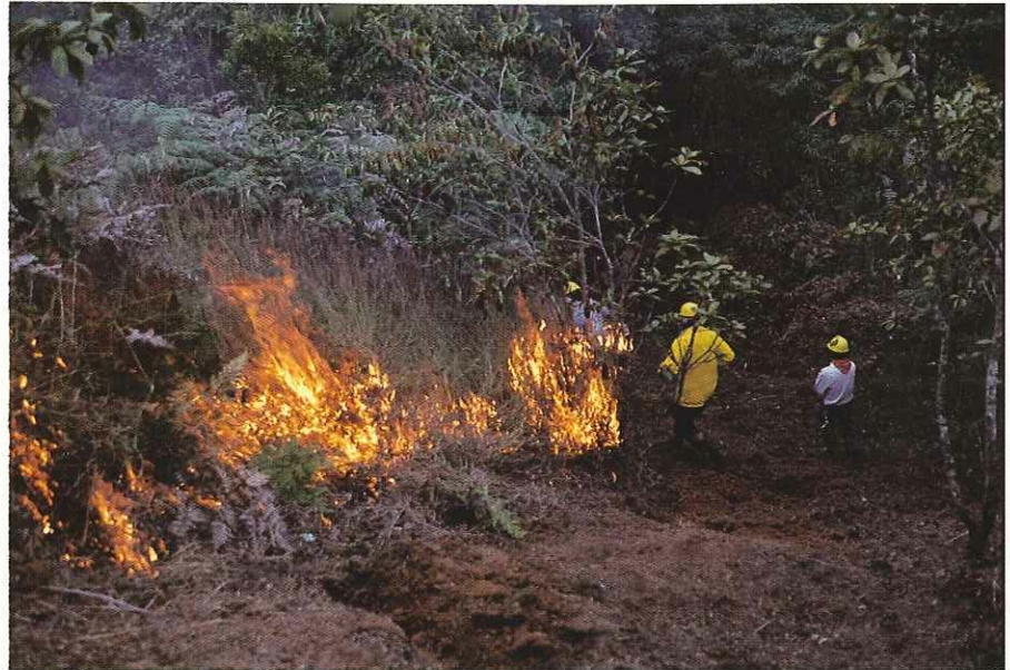
En 1976 un gran incendio que duró tres semanas dañó el 80% del páramo del Chirripó. La recuperación del área tardará años.

POR ESO ESTAMOS fortaleciendo en términos organizativos a las comunidades que están al puro pie de la montaña y estamos trabajando en una propuesta que pensamos presentarle al Gobierno, en la que, básicamente, incluimos un reclamo histórico sobre ese territorio. En la propuesta sobre planificación de esa área, planteamos que somos nosotros los que tenemos que señalar el cómo, el qué y el cuánto, no por ningún deseo de poder, sino porque queremos compartir con el Estado y con la humanidad en general, un conocimiento, una actitud y un amor a todo lo que da la tierra, que hemos ido enriqueciendo desde hace mucho más de quinientos años.