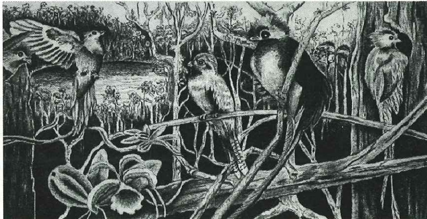
Dibujo: Roy García.

SUPERANDO EL FRÍO -porque es prohibido hacer fogatas, ya que en el pasado hubo un incendio tan grande que se perdió gran parte del bosque- es indescriptible la sensación de pasar una noche en aquella impresionante selva, llena de una multitud de sonidos de animales, incluyendo el de un puma, aunque no logramos ponernos de acuerdo si fueron los nervios los que nos jugaron una mala pasada.