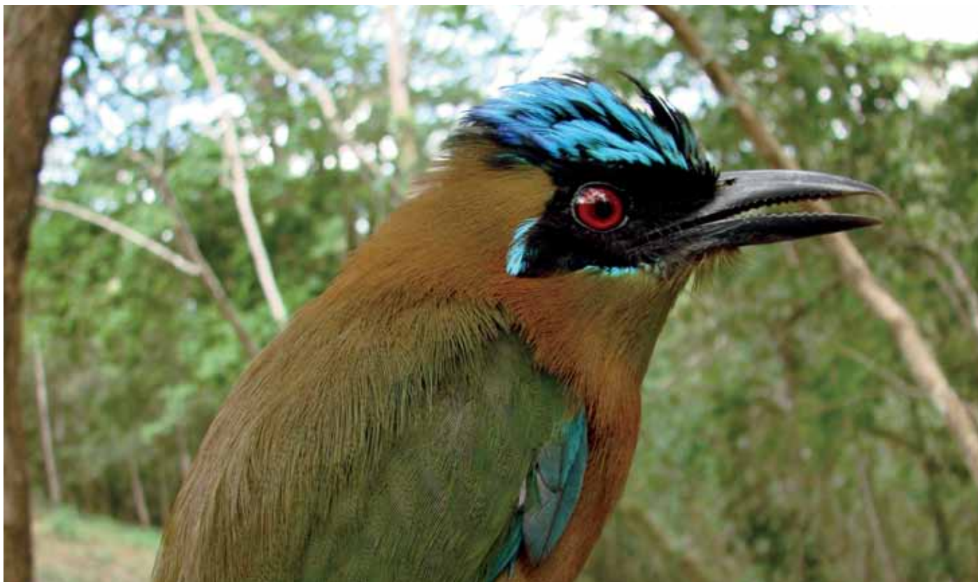
El guardabarranco ( Eumomota superciliosa ), ave nacional de Nicaragua.

La falta de comportamiento de conjuntos anidados en la matriz de ordenación ( p = 0,78 ) entre las especies de plantas y las especies de aves es producto de la heterogeneidad de recursos que la comunidad de plantas proporciona a las aves, comprobando la complementariedad de recursos en tiempo y espacio. Por ejemplo, Ficus sp. proporciona distintos recursos a distintas especies de aves, para algunas especies puede ser sitio de alimentación directa como indirecta, refugio, anidación, entre otros.