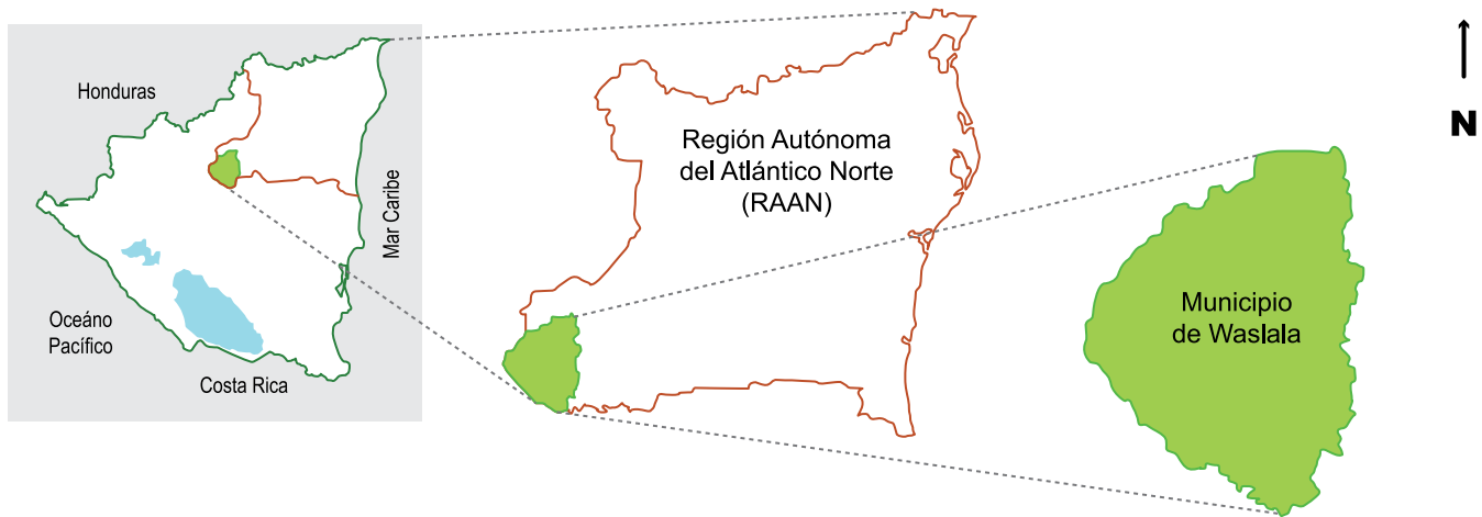
Figura 1. Localización del municipio de Waslala, RAAN, Nicaragua

32 descriptores morfológicos propuestos por Engels (1981) (Cuadro 1). De cada árbol se seleccionó un set de tres frutos (grande, mediano y pequeño) y un set de cinco semillas del centro de la mazorca y se midió el ancho, largo, espesor y grosor de cada fruto y semilla. Para cada árbol, fruto y set de semillas se coleccionaron fotos digitales. Mediante una encuesta semiestructurada a 29 productores se indagó sobre el manejo agronómico aplicado a los árboles promisorios evaluados.