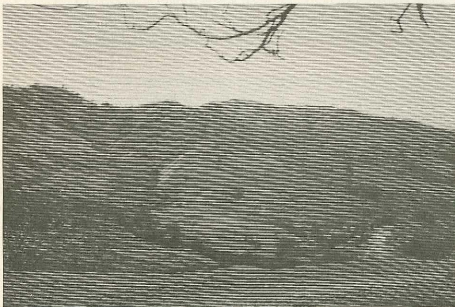
El desarrollo económico de mediano y largo plazo puede verse severamente afectado por el mal uso que se de hoy a los recursos productivos.

a) identificar y cuantificar los impactos físicos del proyecto sobre el ambiente comparando la