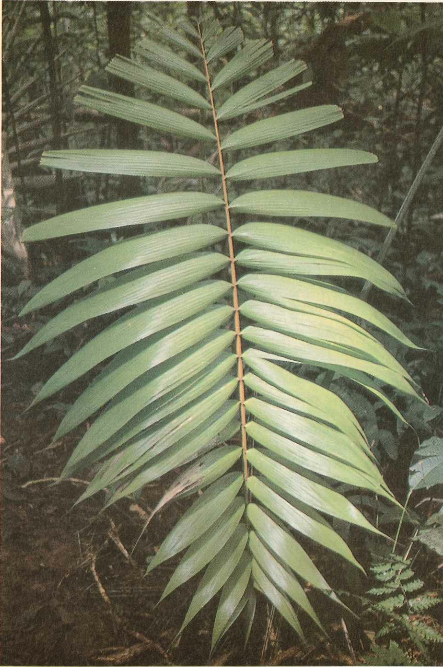
¿Cómo darle valor a la belleza de la naturaleza? (Foto: A. Vera).

Se puede aplicar en aquellos casos y proyectos donde quien provoca la contaminación o sus víctimas perciben los costos del daño ambiental, y desean tomar medidas para prevenir, mitigar o restaurar el mismo.