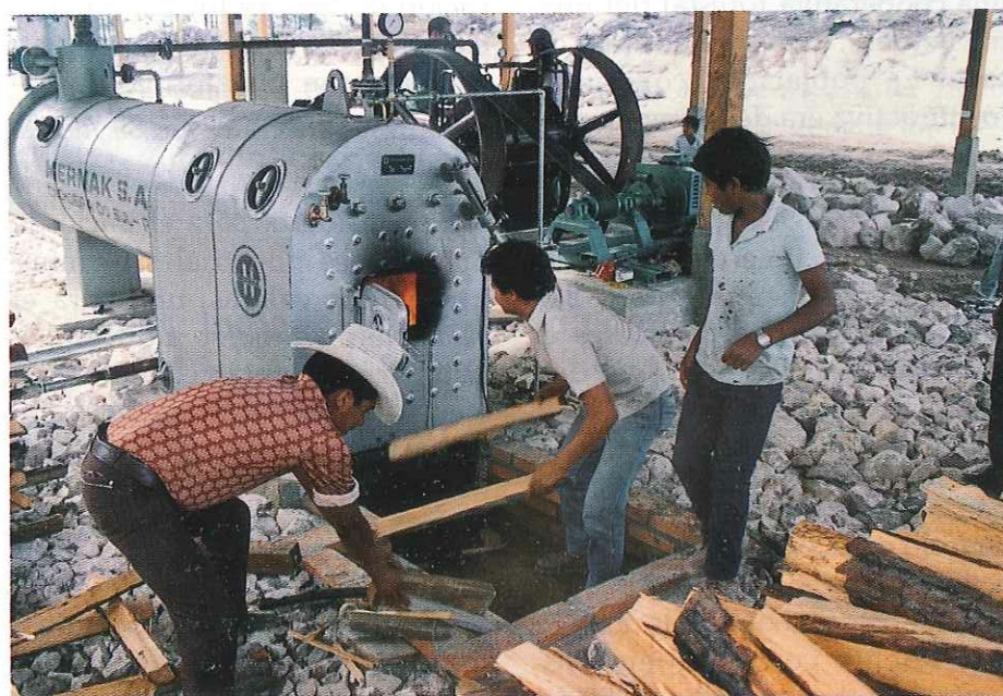
Los campesinos mismos operan la maquinaria (locomóvil) de producción de energía eléctrica. Utilizan como combustible desechos de madera de la industria.

Cabe hacer notar que otras actividades, como resinación, colecta de semillas y carbonización, se desarrollarán como actividades complementarias que, aunque comparativamente menores a la producción de artículos de madera, permiten un aprovechamiento más eficiente del recurso forestal y proporciona oportunidades de empleo.