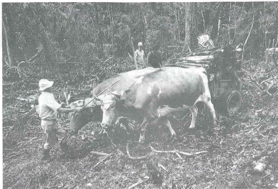
En SIFES se enfatiza el uso de tecnología apropiada. (Foto: T. Stadtmüller).

El bosque ha estado sometido por 20 años a resinación bajo el método de "Copa y Canal". Dicha actividad ha sido realizada por una cooperativa que en la actualidad cuenta con 17 miembros. Cada miembro resinaba 1 250 árboles, lo que suma 21 250 árboles bajo resinación. Debido a que, por lo menos la mitad de los árboles