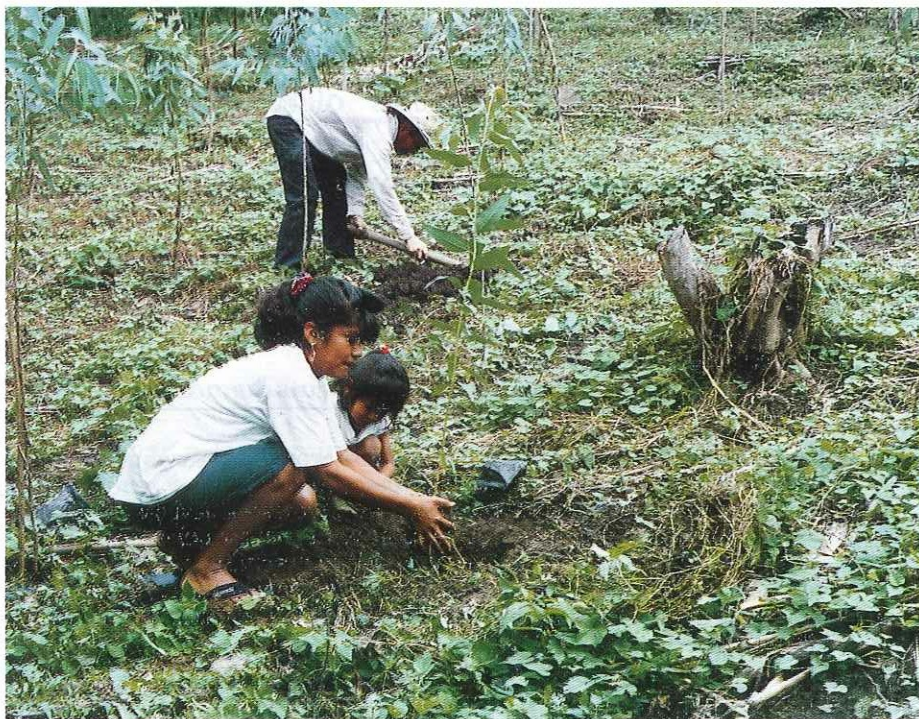
La integración del sector forestal a la economía campesina es el objetivo de PROCAFOR.

El primero de ellos, es un cambio en la rigidez institucional, partiendo desde la propia institución donante, que si bien participó plenamente en la formulación del