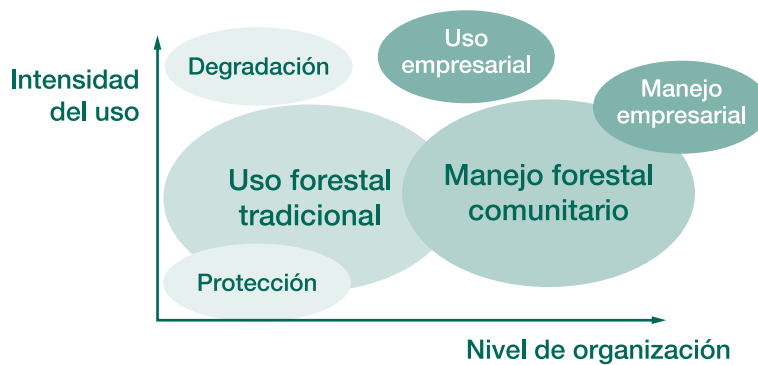
Figura 1-1. Representación del uso forestal con dos gradientes: intensidad de uso y nivel de organización

actores involucrados en el proceso de producción forestal. El nivel de verticalidad abarca esquemas que van desde lo individual hasta organizaciones complejas, como asociaciones o cooperativas y en la forma más sofisticada, empresas; relacionado con ello está la inversión de capital. Como se pretende visualizar en la figura, la forma como se ha promovido el manejo forestal comunitario en América tropical, a pesar de incluir una gama muy amplia de modalidades, tiene un énfasis en los niveles más intensivos del uso forestal y supuestamente los más organizados.