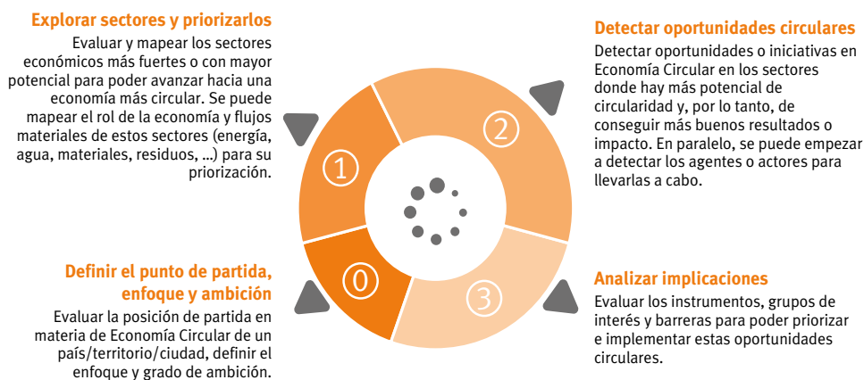
Figura 1. Adaptación de la caja de herramientas para tomadores de decisiones con el fin de ser usada a nivel local

Con base en la caja de herramientas de la FEM, se propone llevar adelante un “Mapeo de Circularidad” que busca alinear en el punto de partida la ambición y enfoque que se quiere tener, para así poder pasar a seleccionar y evaluar los sectores económico más fuertes dentro de los cuales posteriormente se identificarán las oportunidades de EC. Finalmente, se analizan las implicaciones y las barreras vinculadas a dichas oportunidades, así como los instrumentos de política y los grupos de interés a ser involucrados a fin de priorizar y llevar a cabo dichas oportunidades circulares ( ¡Error! No se encuentra el origen de la referencia.¡Error! No se encuentra el origen de la referencia. ).