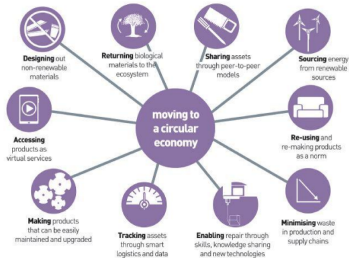
Figura 3. Cambios claves para una economía circular