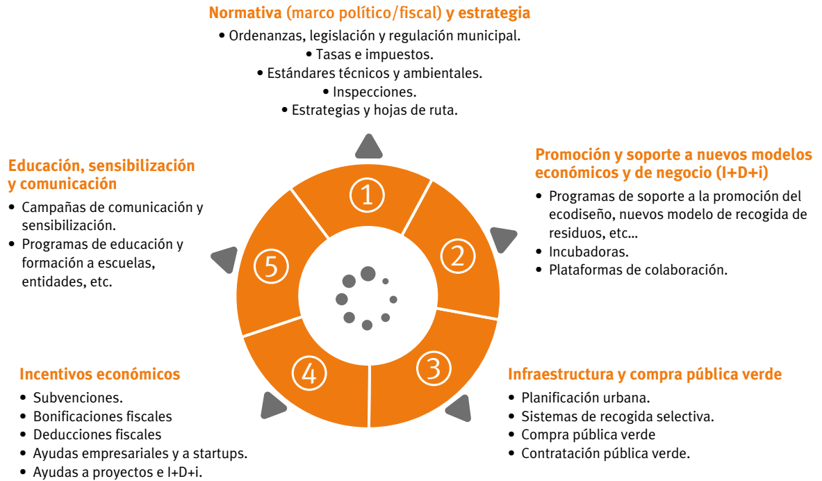
Figura 2. Instrumentos que disponen las Administraciones Públicas para actuar a favor de la Economía Circular

Fuente: (S. P. de G. A. D. de A. y P. T. lhobe, 2019)