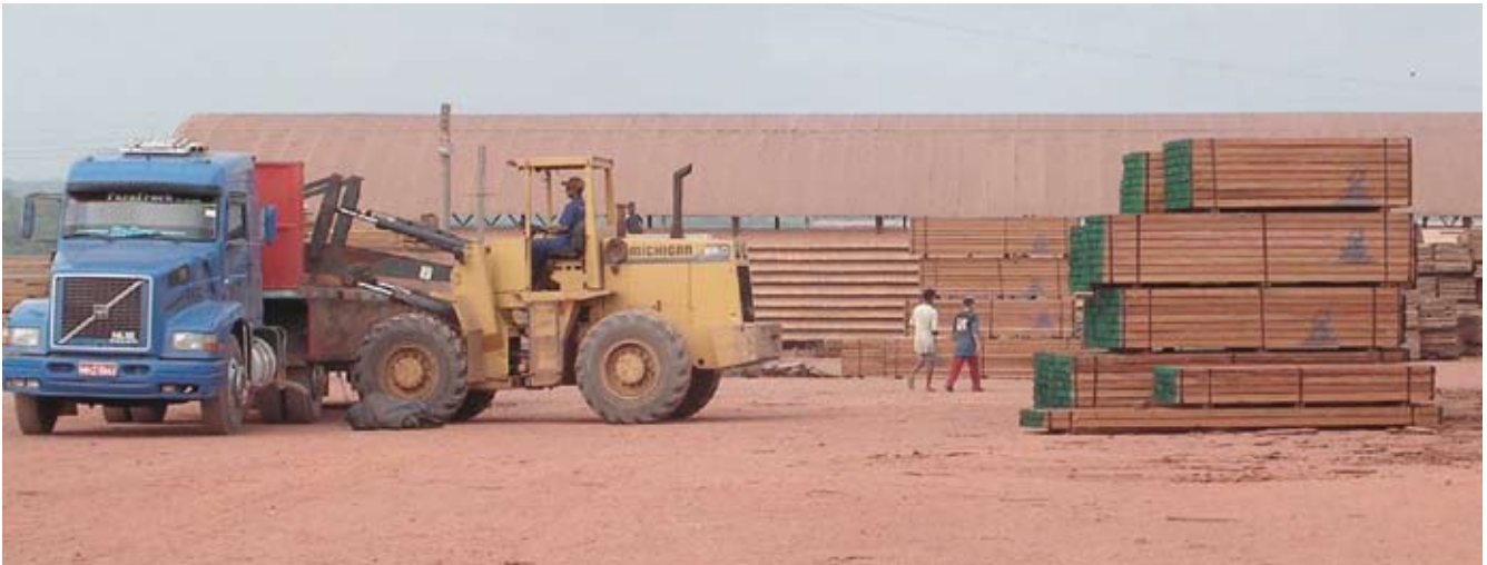
Foto 1. Patio de acopio de madera perteneciente a una empresa maderera

internacionales que mueven billones de dólares al año (Foto 2). Además, muchas de las especies madereras extraídas actualmente de los bosques tienen un uso no maderero, lo que apunta a un conflicto potencial de uso. Según Martini et ál. (1994), un tercio de las especies madereras que se extraen en la Amazonia brasileña tienen también valor como frutales, medicinales o resinas. Esta situación ha contribuido a que instituciones, como la Organización Internacional de Maderas Tropicales, hayan incrementado de forma significativa la financiación a proyectos sobre PFM con mercados internacionales consolidados o con potencial para desarrollarlos (Auler y Farley 2003). También se ha visto un incremento notable en el número de iniciativas para identificar e integrar, dentro de los inventarios forestales, aquellos PFM con mercados bien desarrollados (Lund 1998, Guariguata y Mulongoy 2004).