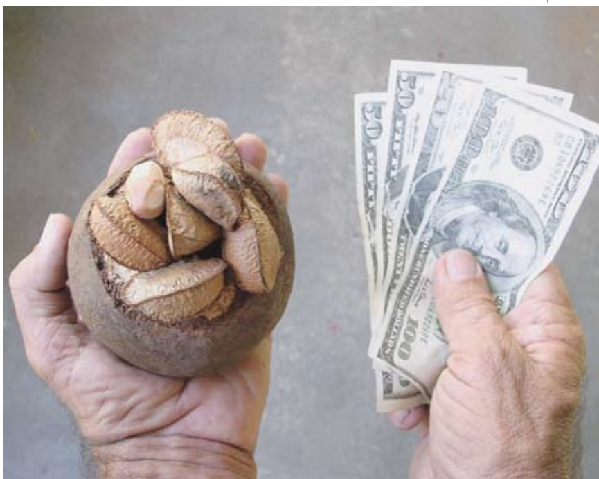
Foto 2. El mercado internacional de la castaña mueve alrededor de US$65 millones anuales y representa una fuente de ingresos fundamental para muchas comunidades extractivistas en la Amazonia