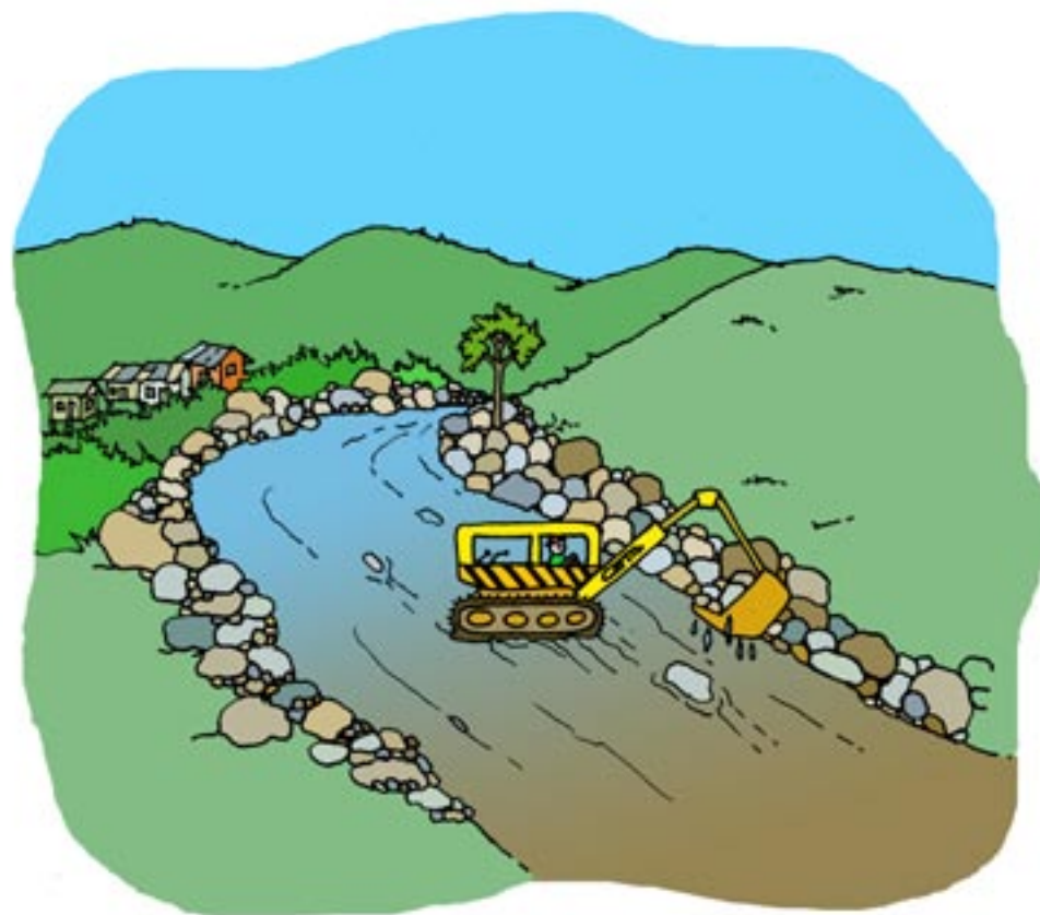
↑ Dragado de ríos para ampliar su cauce