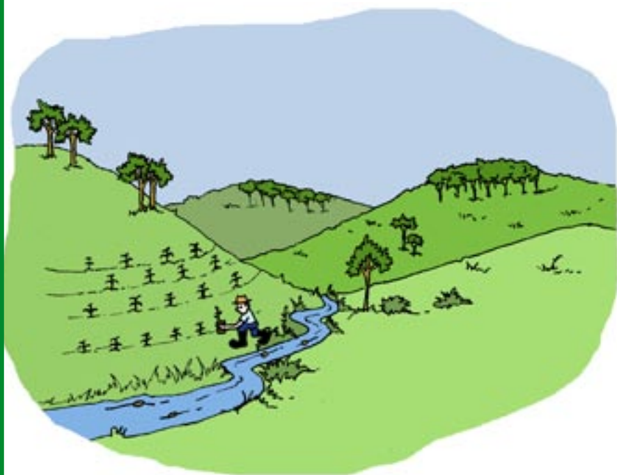
↑ Reforestación en cuencas