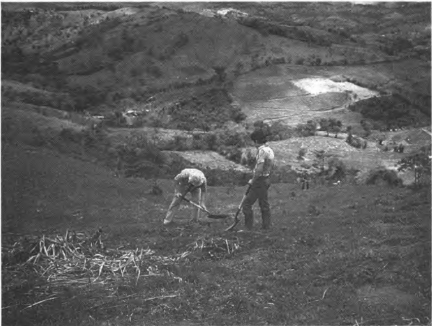
Agricultores durante la faena de preparación del terreno en San Ramón, Costa Rica.

Durante el período analizado (1988-1990) se midieron 83 faenas dentro de la categoría de preparación del terreno: 14 en Guatemala, 12 en Honduras, 40 en El Salvador y 17 en Costa Rica. Las faenas mecanizadas fueron solamente cinco, (ver Cuadro 2).