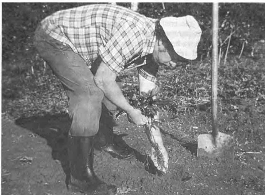
Faena de plantación de árboles a raíz desnuda. Guápiles, Costa Rica.

Cuando ya está preparado el terreno, se procede a sembrar o a plantar el componente arbóreo. Generalmente esta actividad se hace por siembra directa o plantando arbolitos en bolsa, pseudoestaca o a raíz desnuda. La elección del sistema depende de factores como, el costo, el crecimiento de la especie, la densidad de plantación, la disponibilidad de semilla, el tipo de especie, la germinación, el transporte y las condiciones del sitio. La investigación de faenas se concentró en determinar cuál es el costo para establecer una plantación pura y para un cerco vivo, con plantas en bolsa y con un sistema manual.