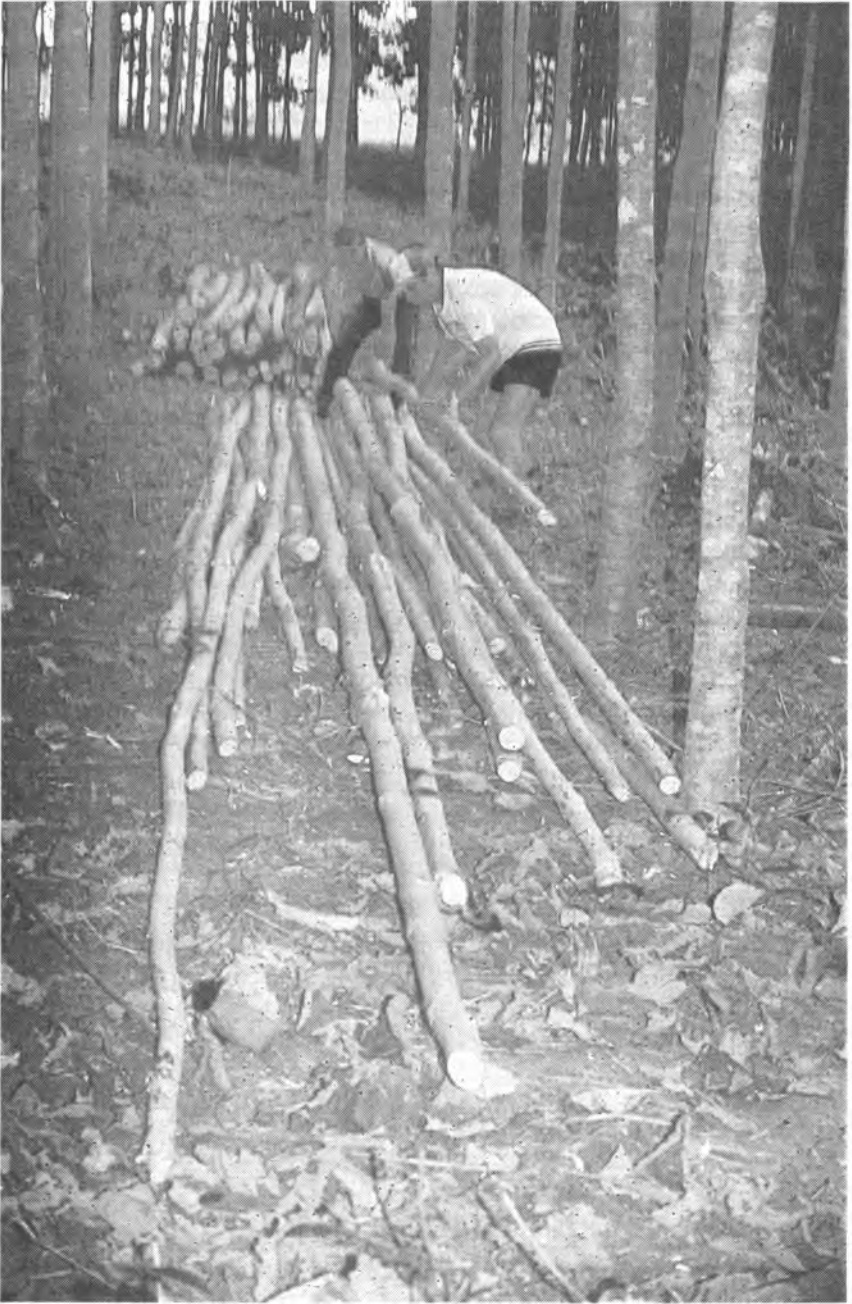
Postes de Gmelina arborea obtenidos como producto de las actividades de raleo en Hojanca, Costa Rica.