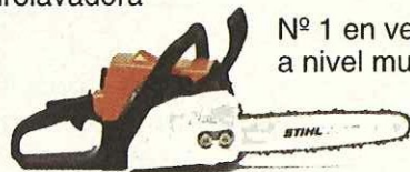
Nº 1 en ventas a nivel mundial