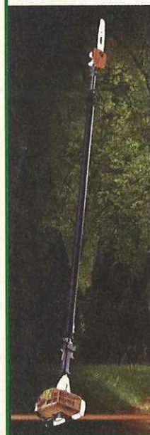
Motosierra telescópica para poda en altura

Porque para cada uno de sus modelos tiene respaldo en: • Mantenimiento y respuestas originales. ¡Pásese a la Familia STIHL !