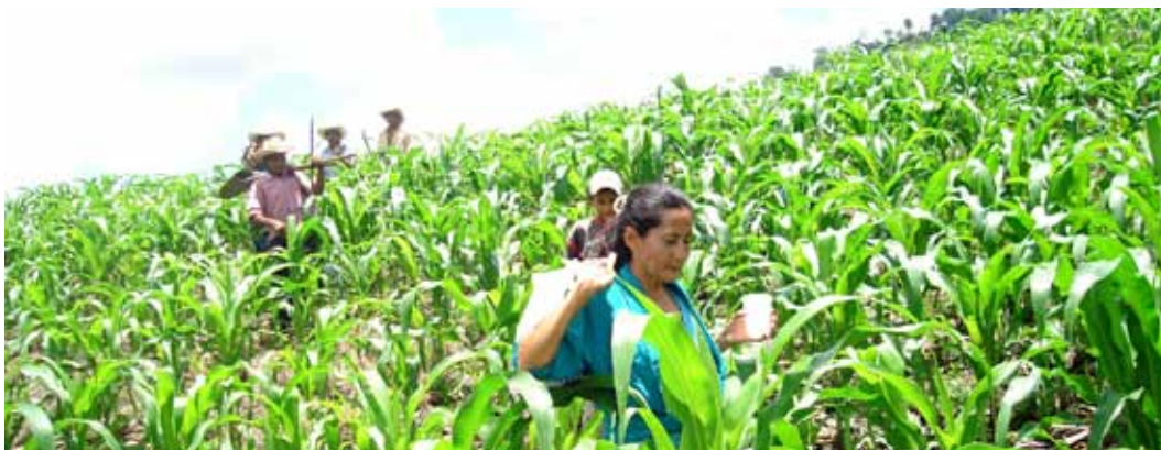
El CATIE trabaja con organizaciones socias para el manejo sostenible de la tierra en la región Trifinio.

L a región Centroamericana es muy vulnerable a sufrir problemas de degradación de tierras, se estima que cerca del 50% de la tierra para uso agropecuario están degradadas de alguna forma. Lo anterior tiene consecuencias como baja productividad, degradación ambiental, impactos económicos y sociales, esto, junto con los efectos que se prevén como resultado del cambio climático, amenaza los medios de vida de las familias productoras, así como la sostenibilidad de los servicios ecosistémicos.