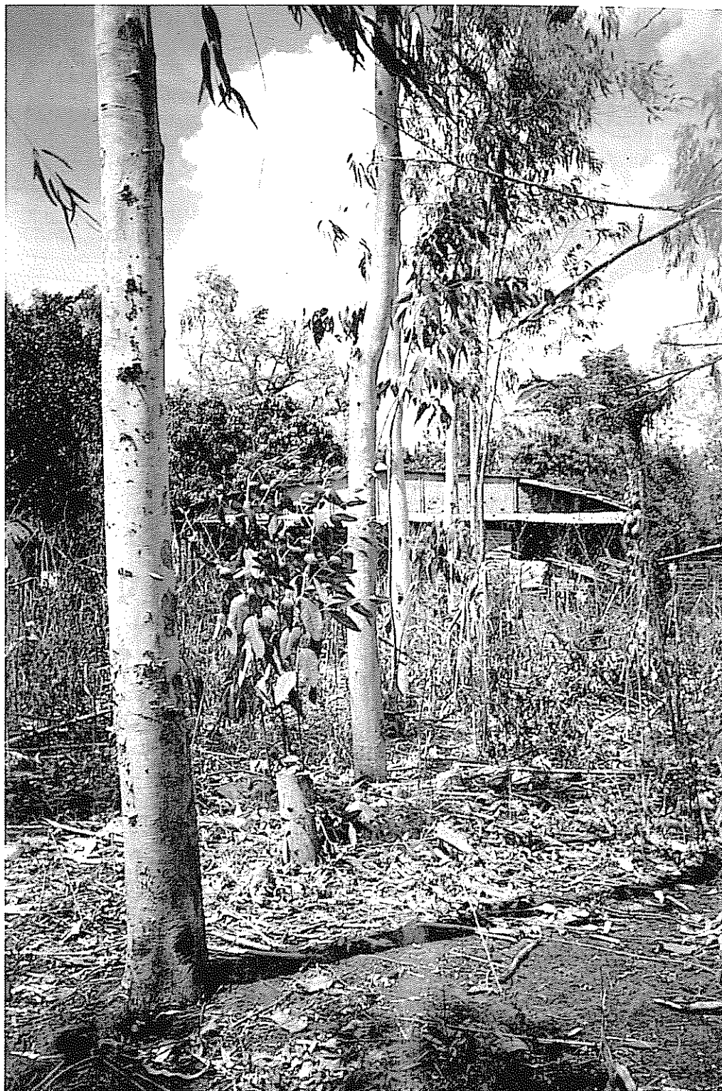
La especie arbórea predominante fue E. camaldulensis , que abastece de materia prima para las necesidades forestales de la familia. La combinación maíz/sorgo y el arreglo en bosquetes fueron los mayoritariamente encontrados

Para determinar la rentabilidad económica de los AUM y los sistemas agroforestales se recolectó información sobre: costos de producción, rendimientos y beneficios económicos de los principales cultivos; volumen en pie de las plantaciones forestales, sobrevivencia e incremento medio anual; valoración de la plantación en pie y del producto extraído; costo de la