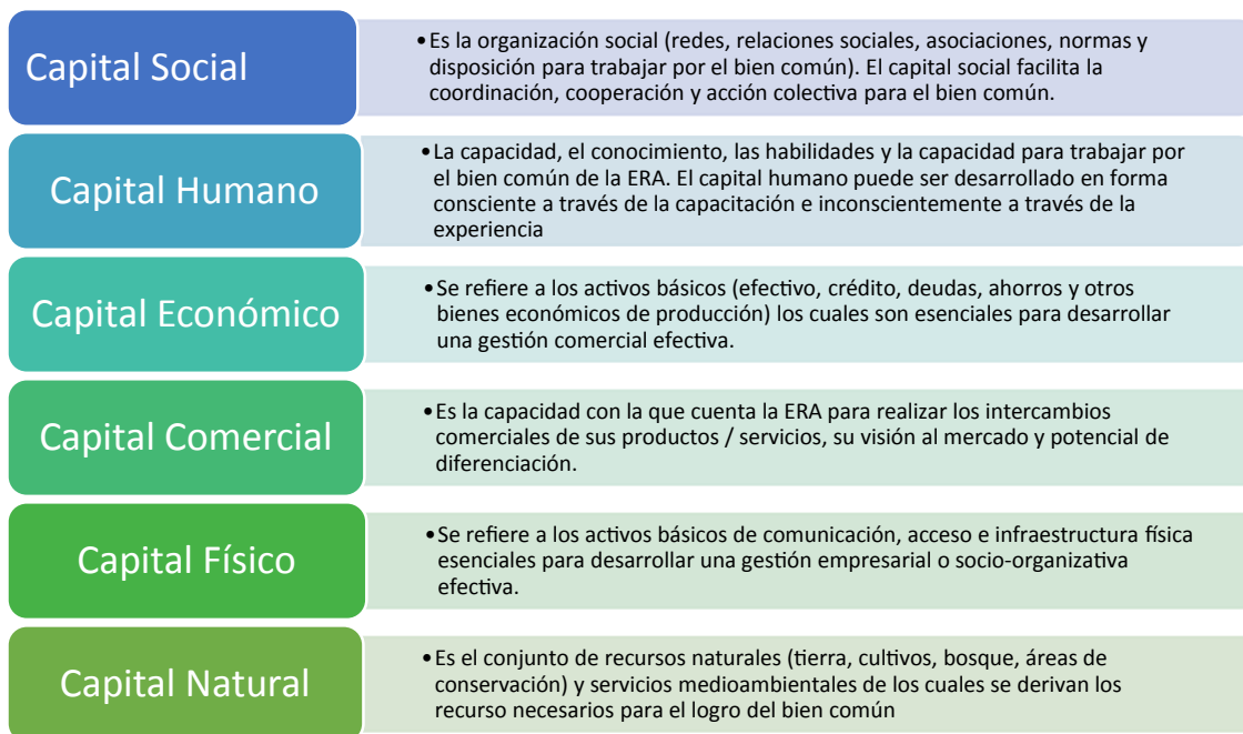
Figura 1. Capitales que describen la gestión empresarial y socio-organizativa de la ERA.

La herramienta de diagnóstico está estructurada según los capitales que constituyen el enfoque de Medios de Vida Sostenibles adaptados a la realidad de las empresas (Figura 1).