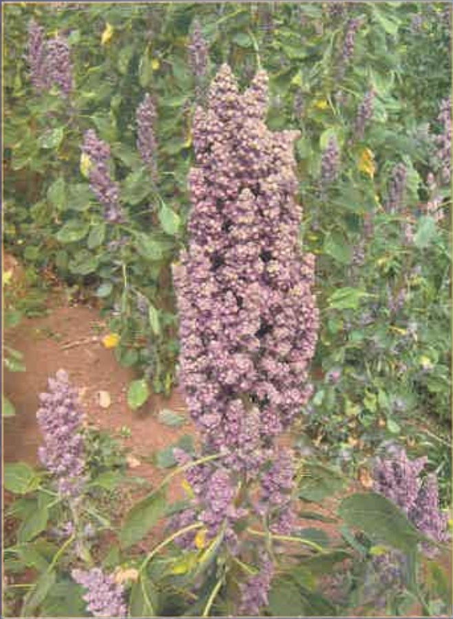
La quinua ( Chenopodium quinoa ) es un grano alimenticio milenario que se cultiva en la zona andina, desde Colombia hasta el norte de Chile. Se utiliza en la alimentación desde hace por lo menos 3.000 años, siendo aprovechado desde entonces por su alto valor nutricional (Tapia y Fries).