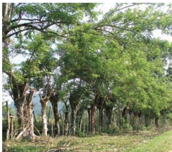
Cerca viva compleja y amigable a la biodiversidad

El valor de conservación y producción de las cercas vivas puede ser mejorado con la incorporación de especies maderables que ayuden al abastecimiento de madera y leña al productor, disminuyendo el tiempo invertido en la búsqueda y obtención de éstos. De igual manera, la siembra de frutales para el consumo de la familia y su comercialización puede generar un ingreso extra al productor.