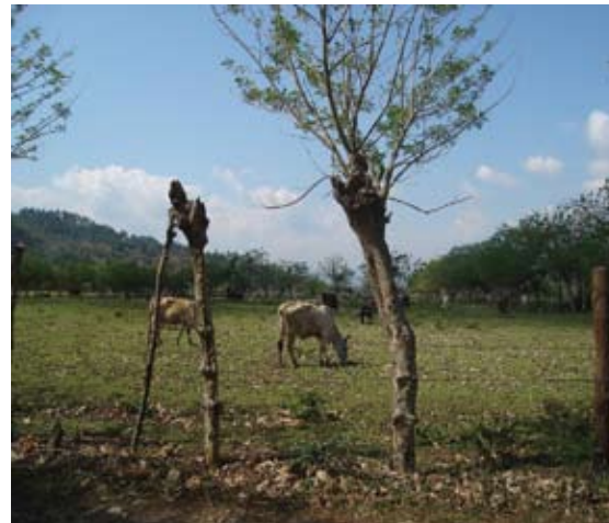
Cerca viva podada (45 especies de aves, Lang et ál. 2003)

Es importante mencionar que el mantenimiento de una cerca muerta es de aproximadamente 1.500 lempiras/año, que incluye cambiar alrededor de 100 postes muertos por kilómetro, acarreo, corta y siembra de los postes (Edgardo Madrid, comunicación personal).