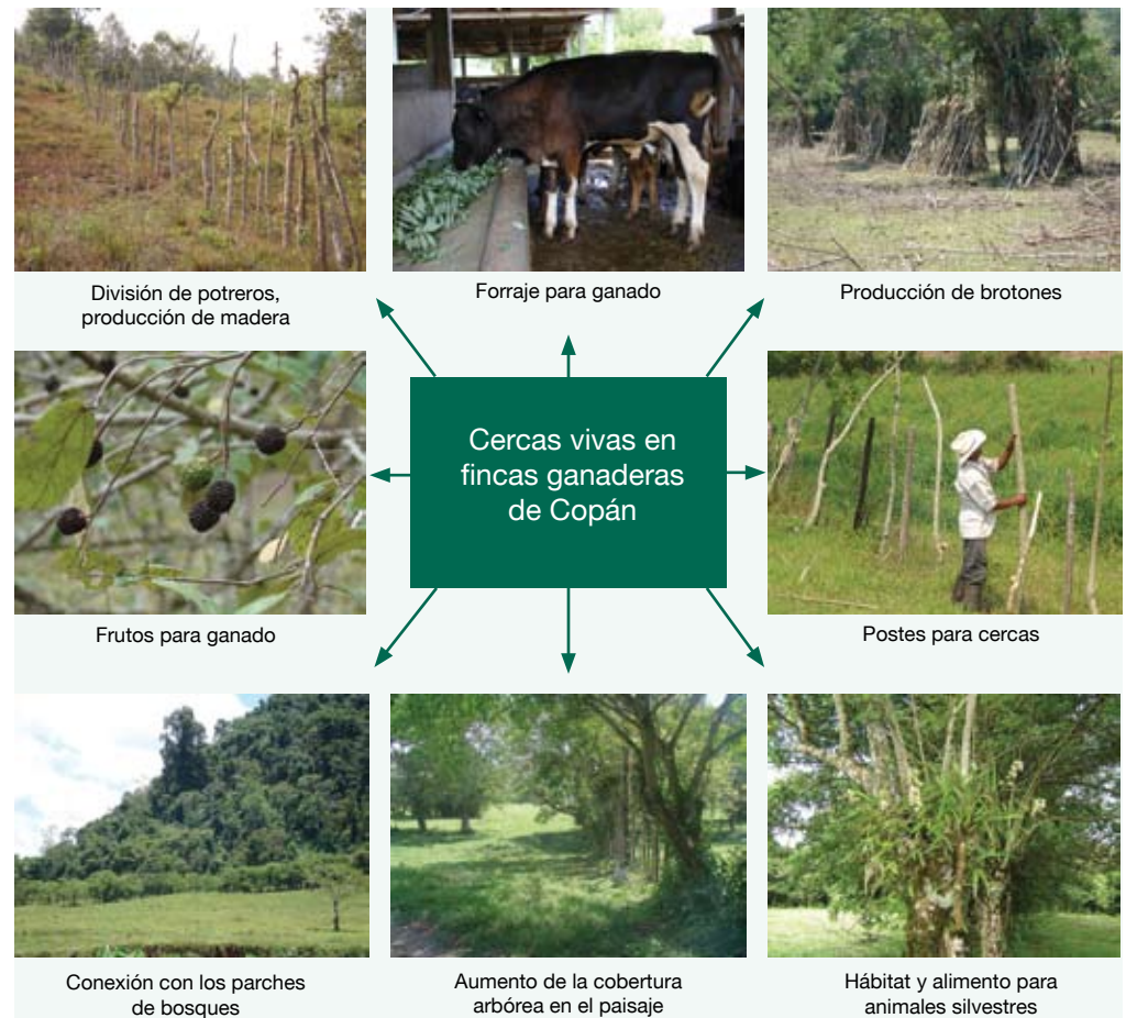
Figura 1. Beneficios sociales, económicos y ambientales de las cercas vivas en el paisaje ganadero de Copán.

pasto guinea ( Panicum maximum ) y el zacate bahía o hierba miel ( Paspalum notatum ) han mostrado ser tolerantes a la sombra. Los árboles como el cedro ( Cedrela odorata ), laurel ( Cordia alliodora ) y macuelizo ( Tabebuia rosea ), entre otros, presentan una copa que permiten una buena entrada de luz lo que propicia un adecuado crecimiento del pasto. Además, la poca área que ocupa la cerca viva, minimiza su impacto sobre la productividad del pasto y generalmente los productores tratan de mantener este espacio limpio para que funcione como cortafuegos en zonas con época seca marcada.