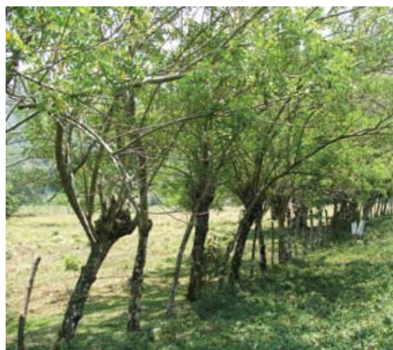
Cerca viva simple compuesta de una sola especie