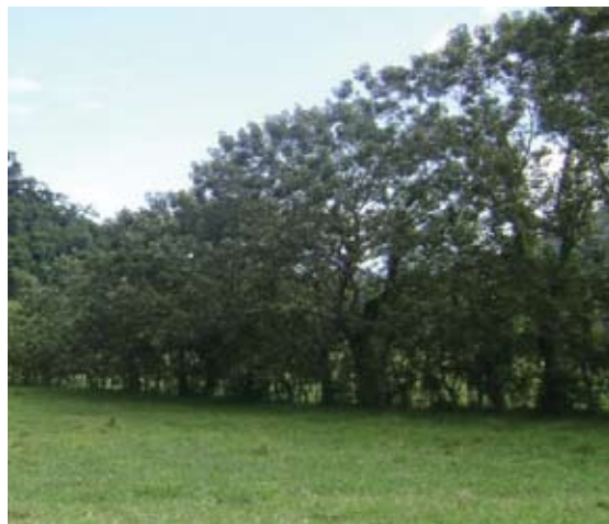
Cerca viva sin podar (81 especies de aves, Lang et ál. 2003)