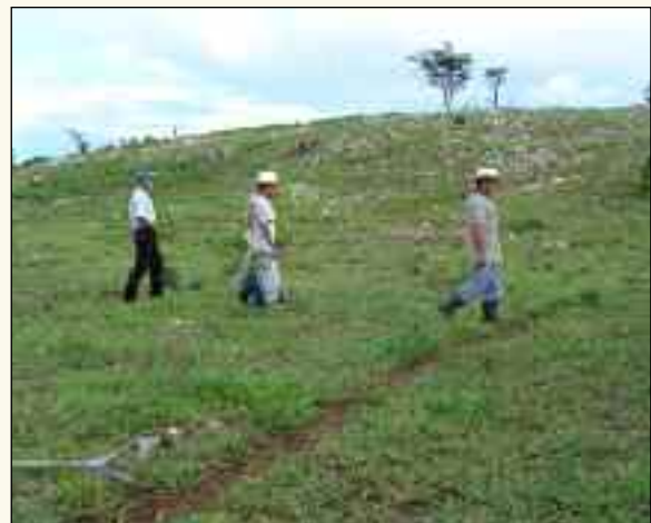
Suelos de Petén, Guatemala, con presencia de mucha roca caliza