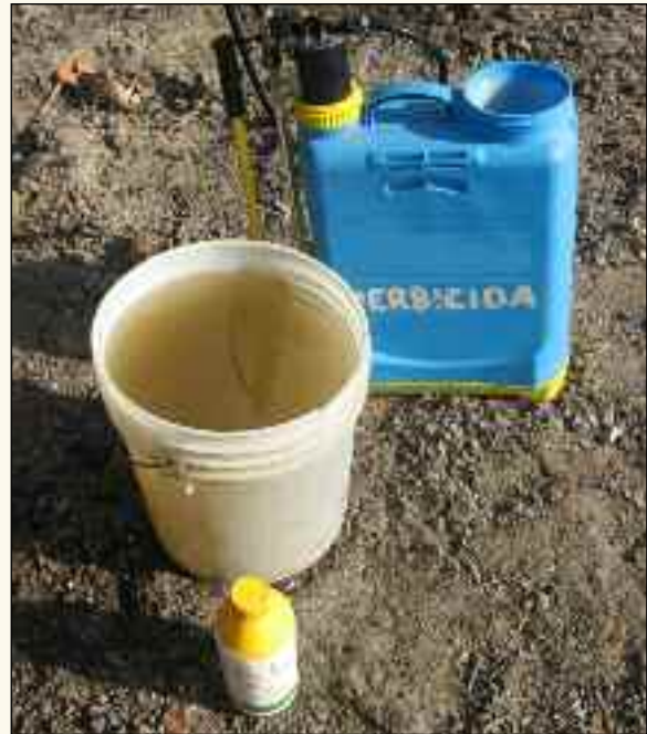
No se debe usar agua sucia

Sin embargo, muchas aguas en Centroamérica son “duras”, sobre todo en regiones donde hay roca caliza como el Petén en Guatemala o el Yucatán en México, y en zonas secas, como la vertiente Pacífica de Centroamérica. Además, generalmente, el agua de pozos profundos es “dura”.