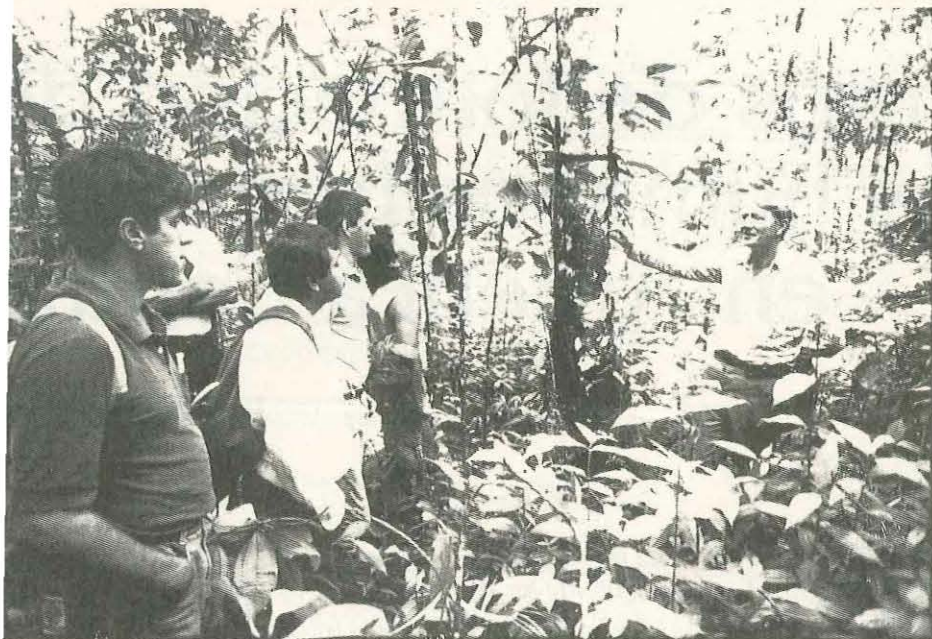
Las prácticas en el bosque son fundamentales en la enseñanza forestal. (Foto: A. Vera).

y proyectos del PAFT, se seleccionaron cuatro rasgos principales como criterio de agrupación: nivel académico, campo laboral, región ecológica y ubicación geográfica. Además, se consideró su relación con el sistema educativo agropecuario y la prospectiva.