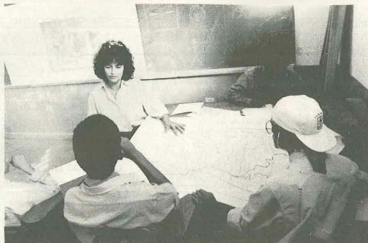
Una clase en el ESNACIFOR, Honduras.

de prácticas para la formación de técnicos para toda la región. Además, tiene un cuerpo de profesores numeroso y capacitado, reúne en el mismo sitio otros órganos relacionados, como el Centro de Capacitación Forestal y el Centro Nacional de Investigaciones Forestales Aplicadas.