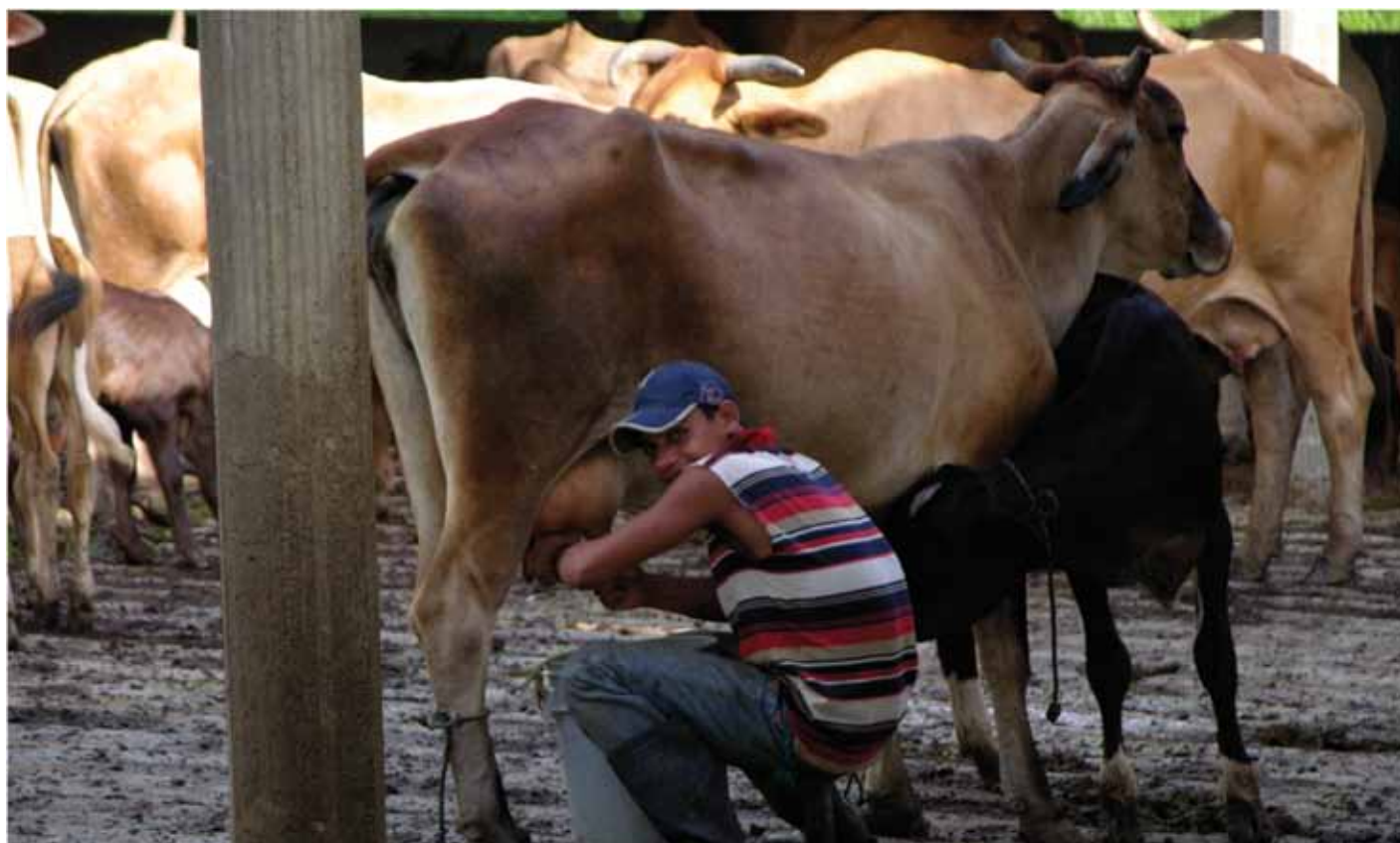
Productor ganadero de la zona de Matiguás, Nicaragua.

A cada uno de los dueños de las fincas (22 personas) que eran aledañas a todos los parches de bosque mayores a 10 ha en la cuenca baja del río Bulbul, Matiguás, se les realizó una entrevista con el objetivo de identificar la factibilidad