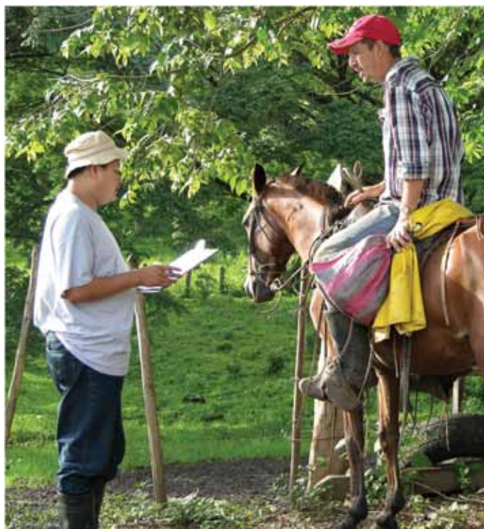
Entrevista con los productores de la zona de Matiguás, Nicaragua.

Aunque en Nicaragua existe una prohibición de cambio de uso de las tierras cubiertas con bosque, salvo para proyectos de interés nacional (Art. 53 Reglamento Forestal), los productores de Matiguás siguen cambiando el uso del suelo de sus fincas libremente de acuerdo a lo que más les convenga, pese a que es contra la ley. Lo mismo sucede en la Región Atlántica de Nicaragua, donde el 48% de los finqueros asegura que desaparecerá el bosque dentro de su propiedad por la necesidad de ampliar sus áreas agropecuarias (Altamirano 2002). También, en fincas ganaderas aledañas a la cuenca del río Bulbul se denotó durante esta investigación la tala de bosques, con el fin de expandir tierras para pastura (obs. pers.) y esta posición de los productores ante el uso del recurso forestal demuestra que no sólo están tomando decisiones por encima de la ley, sino que también muestra que los mecanismos de control y regulación por parte de las instituciones