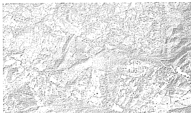
Figura 1. Ortomosaico representativo de parte del área ganadera comprendida por el proyecto Enfoques Silvopastoriles Integrados para el Manejo de Ecosistemas en Costa Rica