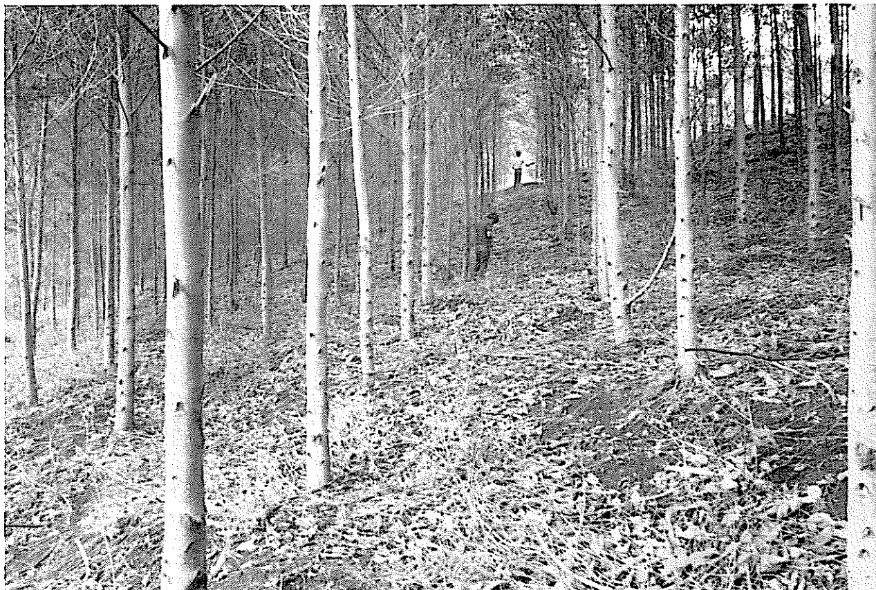
Plantación de Eucalyptus saligna de 30 meses de edad en Piedades Norte, San Ramón, Costa Rica. (R. Salazar).