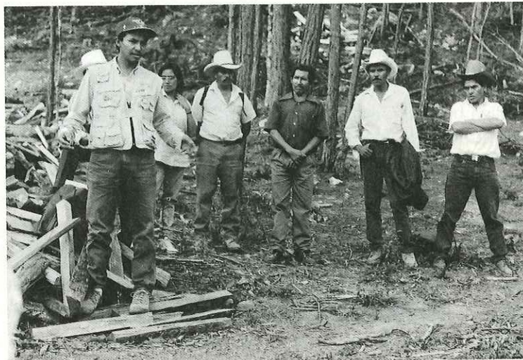
Los técnicos de MAFOR han trabajado con responsabilidad y mística en el proceso de capacitación de la población de Lepaterique. (Foto: J. Barahona).

Con todos estos actores que intervienen en el proceso de ejecución del plan de manejo, se elaboró un reglamento en el cual se estipulan los deberes y derechos y se definen las aportaciones que cada uno de estos grupos hace al Fondo de Manejo Forestal Municipal.