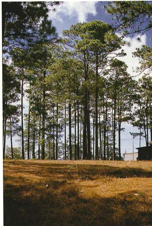
Lepaterique posee un área total de 48 000 ha con vocación forestal, cubiertas de pino maduro y sobremaduro.

La Cooperativa Agroforestal Lepaterique Ltda. se formó en 1974; cuenta actualmente con 718 socios, dedicados a la producción de leña y resina de pino.