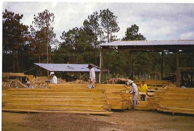
El proceso de desarrollo en la comunidad ha sido sumamente dinámico. Actualmente existen 20 microempresas de aserrío manual y se logró fundar INDUMALSA, una industria forestal propiedad de los campesinos.

En este aspecto, los pobladores de Lepaterique se han organizado en 20 microempresas de aserrío manual, utilizando las coníferas, para obtener madera para aserrío y leña. Actualmente, se están gestando ocho microempresas más. El proceso de formación de estas microempresas se inicia con la participación de grupos informales de 12 a 15 personas solidarias, que reciben formación intensiva en organización, tecnología forestal, gestión empresarial campesina y un apoyo financiero de alrededor de 3 000 Lps. por socio, que suma al capital de inversión, generalmente en herramientas manuales y capital de trabajo. Este apoyo financiero proviene de un fondo rotatorio, creado por PROCAFOR para desarrollar actividades productivas en calidad de préstamo; los recursos están depositados en una cooperativa financiera y las decisiones de su uso atañen a un comité de crédito integrado por representantes de COHDEFOR, PROCAFOR y de los campesinos.