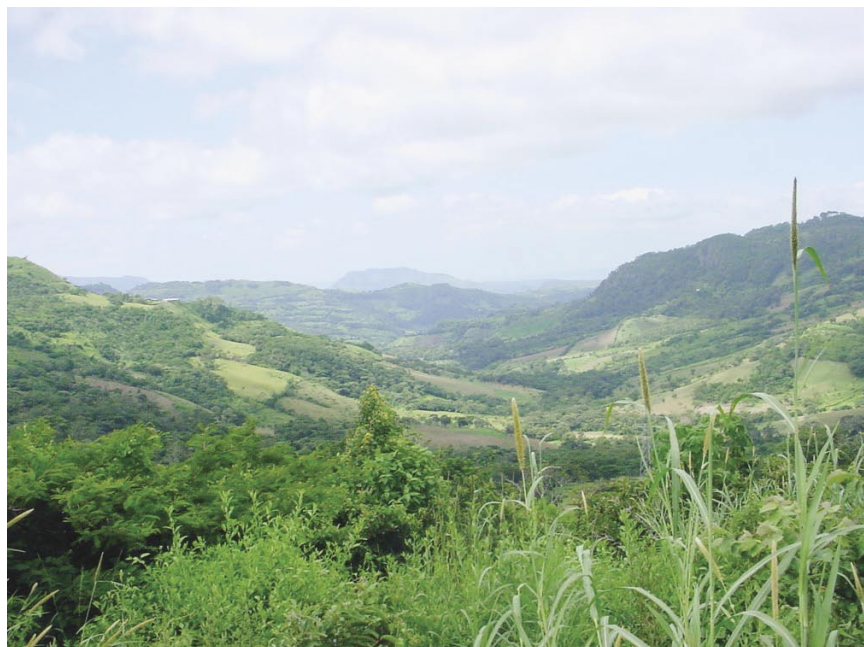
Vista panorámica en la subcuenca del río Jucuapa, Nicaragua

La subcuenca de río Jucuapa tiene una extensión de 40,5 km 2 y drena sus aguas en el río Grande de Matagalpa. Se ubica entre las coordenadas 12°50' y 12°53' Norte y 86°02' y 85°53' Oeste. La temperatura media anual oscila entre 23°C en la zona alta y 30°C en la zona baja (Vallecillo et al. 2001). La cuenca presenta fuertes pendientes