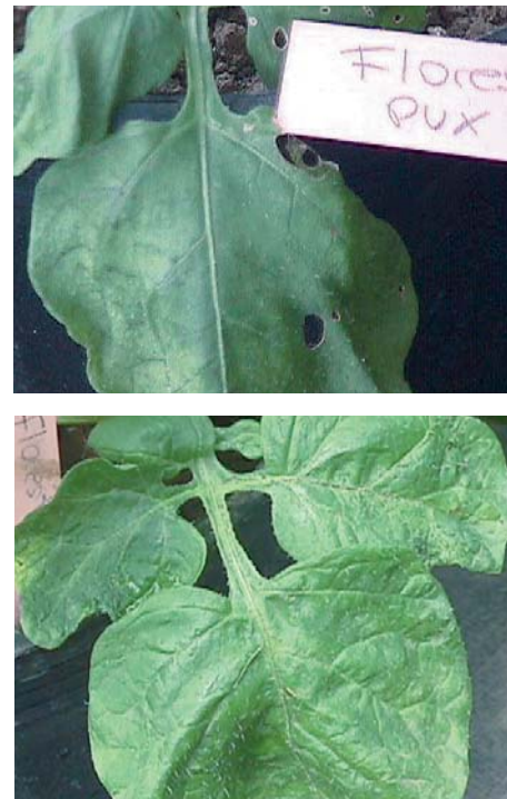
Figura 3. Síntomas producidos por la infección con PVX en plantas de la variedad Floresta. A. Quince días después de la inoculación con PVX se observa mosaico, principalmente en la hoja inoculada. B. Mosaico severo observado al mes y medio después de la inoculación, generalizado para toda la planta.

En ambas variedades se observaron mosaicos y moteados. La variedad Floresta presentó una sintomatología más severa al inocularse con PVX y PVY que la variedad Granola. La variedad Floresta presentó un mosaico 15 días después de la inoculación con PVX, síntoma que llegó a ser severo a los 45 días (Fig. 3). Esta variedad mostró un moteado 15 días después de ser inoculada con PVY, que se tornó más severo a los 45 días de inoculación con el virus (Fig. 4). La variedad Granola presentó clorosis 15 días después de inoculada con PVX, que se incrementó levemente en los siguientes días (Fig. 5). Con el virus PVY se produjo una clorosis similar a la observada con PVX, que se mantuvo en un nivel leve durante los siguientes meses y hasta la cosecha (Fig. 6).