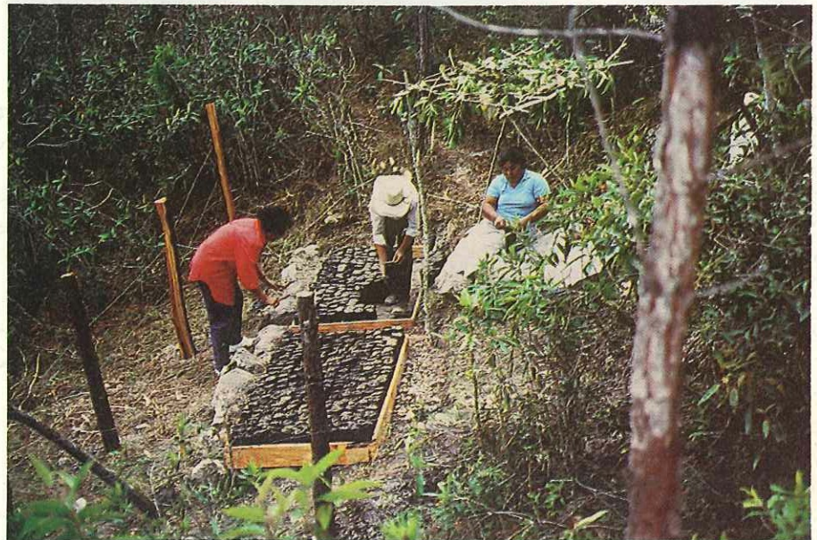
La actividad forestal debe ser rentable involucrando y beneficiando a las familias rurales. En la fotografía pobladores rurales de la finca Morales de Honduras, trabajan en el establecimiento de un vivero.

En América Central aunque se han hecho esfuerzos en materia de investigación forestal, estos no han sido suficientes. Hay avances en investigación académica y aplicada, pero no se ha hecho mucho por validar sus resultados y divulgarlos.