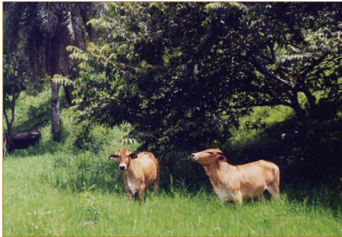
Ganado aprovechando la sombra de los árboles en un potrero en Cañas, Costa Rica (proyecto FRAGMENT).

caste y jenízaro— son mantenidas en bajas densidades, mientras que las especies con áreas de copa menor —como coyol, laurel y roble— se encuentran en mayores densidades.