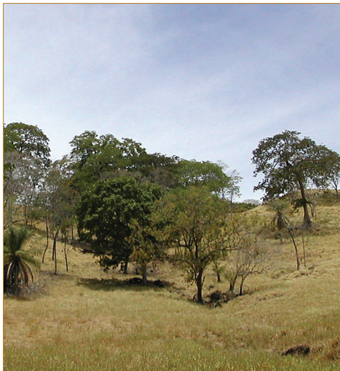
Árboles en potrero en Cañas, Costa Rica (proyecto FRAGMENT).

De las 53 fincas disponibles en la base de datos del proyecto FRAGMENT 4 , se seleccionaron 16 con ganadería activa, distribuidas en cuatro grupos de acuerdo al tamaño y sistema de producción: a) fincas pequeñas (1-50 ha) con sistema de producción mixto (agricultura y ganadería; 4); b) fincas pequeñas (1-50 ha) con sistema de producción de carne (4); c) fincas medianas (50-100 ha) con sistema de producción de carne (5), y c) fincas grandes (> 100 ha) con sistema de producción de carne (3). Las 16 fincas se localizaron en la imagen Ikonos 2001 con una resolución espacial de 1 m y disponible para el proyecto TROF 5 , y se delinearon sus límites utilizando el programa Arcview GIS 3.2 con base en los planos catastrales. Se cla-