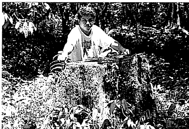
Muestra del aprovechamiento de árboles de Cordia alliodora en las reservas indígenas del Cantón de Talamanca, Limón, Costa Rica.

El estudio se realizó en las reservas indígenas Bribri y Cabécar del cantón de Talamanca, Limón, Costa Rica (9°30' N y 83°20' O; altitud sobre el nivel del mar: 40 - 400 m; precipitación anual: 2800 mm; temperatura media anual: 25,6° C). Existen dos unidades de paisaje: el valle (una coalescencia de abanicos aluviales, suelos Typic Trophent) y las laderas (constituidas de materiales sedimentarios y rocas intrusivas, suelos Oxic Palehumults y Aeritropaquepts). Las etnias predominantes son los Bribris (80%) y Cabécares (15%) de una población estimada de 10000 habitantes en el año 2000. Las actividades económicas principales son: cultivo de plátano ( Musa sp. AAB), banano y cacao, mano de obra asalariada eventual y crianza de cerdos (Kapp 1989; Borge y Castillo 1997).