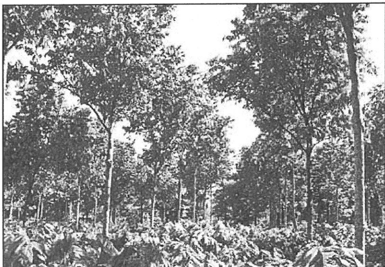
Producción de cacao asociado con Marapolán ( Guarea grandifolia ).

Varios factores influyen en la mortalidad que puede presentarse en el primer año de la plantación, obligando al productor a realizar resiembras oportunas para que la sombra definitiva y permanente para el cultivo sea lo más homogénea y se forme en el menor tiempo posible. En las condiciones del CEDEC, algunas especies no soportaron condiciones críticas de humedad en el suelo, originadas principalmente por las altas precipitaciones provocadas por el huracán Mitch, que causaron la muerte del 40% a 73% de las plantas de San Juan Guayapeño, Cedrillo y Redondo. El resto de las especies presentaron tasas de mortalidad abajo del 25%. En cuanto a plagas o enfermedades, no se presentaron daños de importancia que hayan incidido en la sobrevivencia, aunque el Cedro sí fue afectado por Hypsiphyla grandella que afectó el desarrollo del fuste, sin causar muerte de plantas.