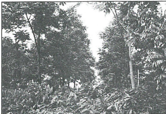
Producción de cacao asociado con cedrillo ( Huerteia cubensis ).