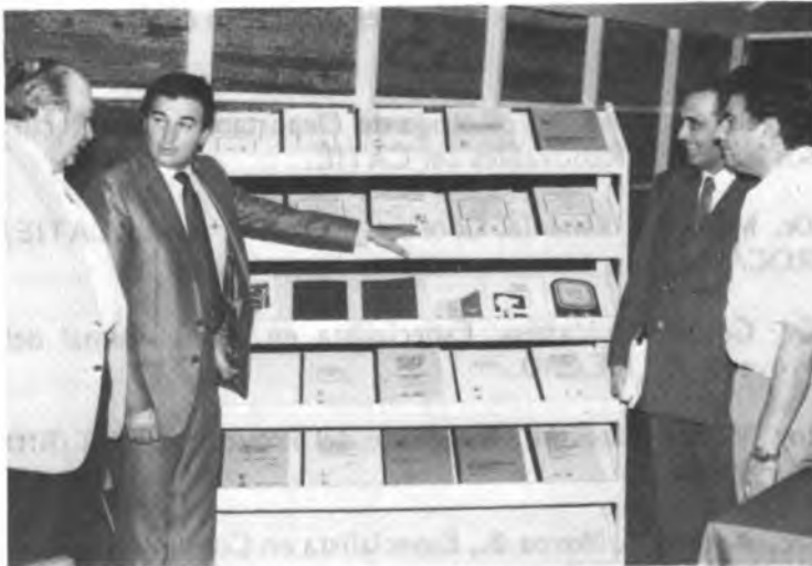
Un aspecto de la muestra montada en la reunión con los informes finales y otras publicaciones del Proyecto CATIE-BID. El Señor Ministro de Agricultura y Ganadería señala a los directivos del BID la importancia de estas contribuciones y el amplio número y calidad de las publicaciones producidas.