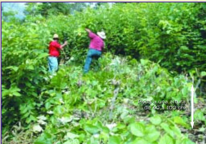
Plantas de cratylia después de la poda