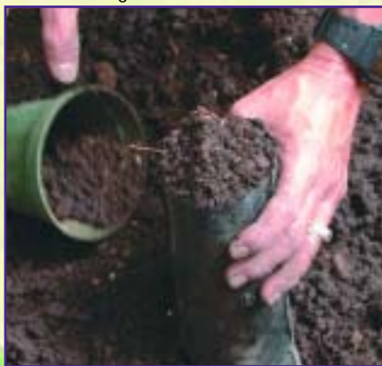
Siembra en bolsa plástica.