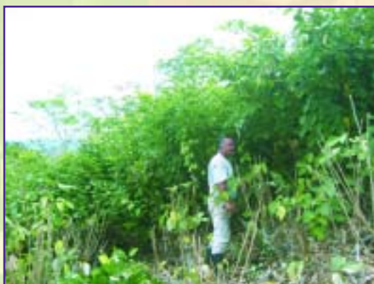
Poda manual de Cratylia argentea

Para la mayoría de las especies leñosas, es apropiado efectuar las podas cada 3 a 4 meses.