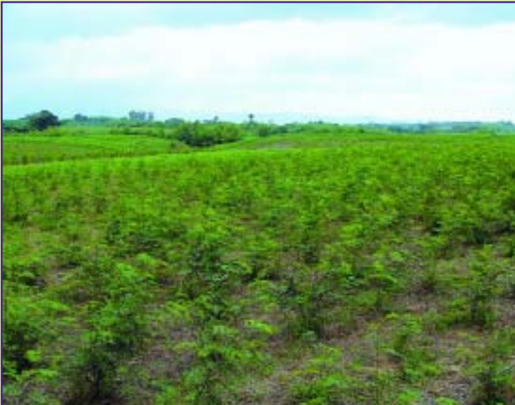
La leucaena crece bien en suelos negros profundos y alcalinos.

La cratylia ( Cratylia argentea ) crece bien en suelos poco fértiles, bien drenados y con 5 a 6 meses de sequía. No crece bien en suelos pesados que tienden a encharcarse.