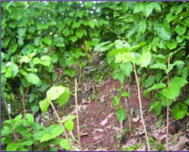
La cratylia crece bien en suelos rojos bien drenados y de buena fertilidad.

Ejemplos de especies que se adaptan bien a las condiciones del trópico seco, son la cratylia , leucaena , guácimo y madero negro