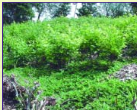
Banco forrajero de cratylia.

Cuando el animal consume directamente el forraje (las ramas y hojas del árbol) en el potrero, junto con el pasto.