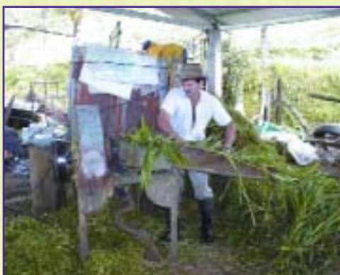
El establo es el sitio ideal para instalar la picadora.