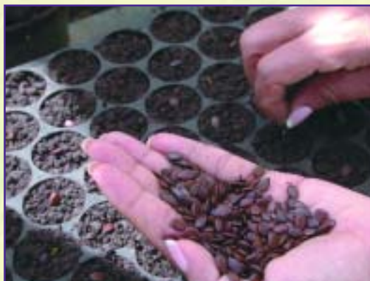
Prueba de germinación de leucaena