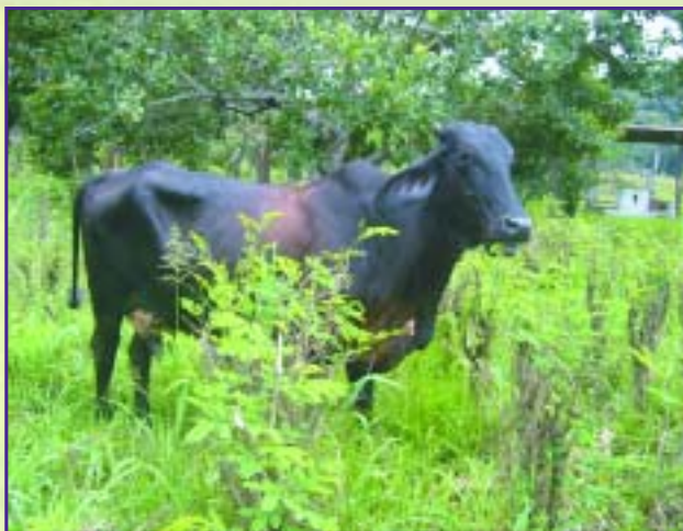
Vaca de doble propósito ramoneando en un banco de leucaena