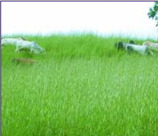
Las vacas pastoreando jaragua solamente producen 3 litros de leche por vaca al día

Cuando se compara la alimentación de los animales suministrando sólo pastura de jaragua ( Hyparrhenia rufa ) contra una dieta a base de pastura mejorada y ramoneo de leucaena durante 2 horas, se puede notar las diferencias en la producción de leche y una disminución menos marcada de la cantidad de leche producida en la época seca.