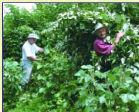
Acarreo de cratylia