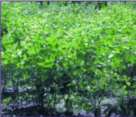
Ejemplo de banco protéico de cratylia

Protéico cuando la especie contiene al menos un 14 % de proteína, como la cratylia, la leucaena y el guácimo.