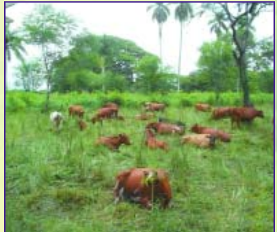
mientras que las vacas pastoreando en un banco forrajero de pastura mejorada y leucaena producen 6 litros de leche por vaca al día.