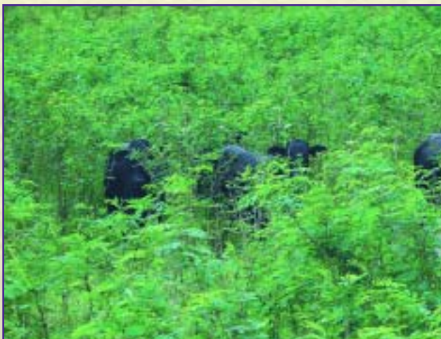
Banco forrajero de leucaena

Con esta modalidad, se debe regular la carga animal y tener un pastoreo rotacional, para asegurar la persistencia del banco.