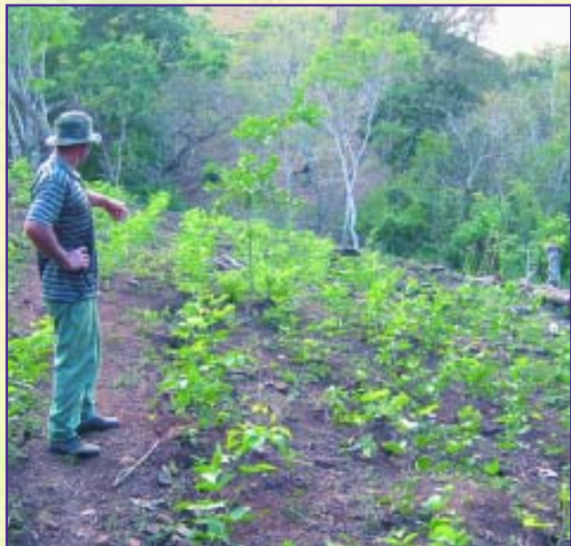
Plántulas de cratylia de 4 meses de edad en siembra directa.