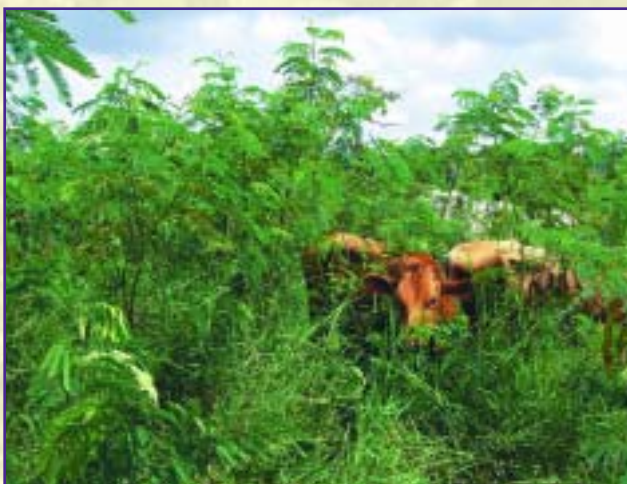
Vacas ramoneando un banco forrajero de leucaena

Con esta modalidad, se debe regular la carga animal y tener un pastoreo rotacional, para asegurar la persistencia del banco.