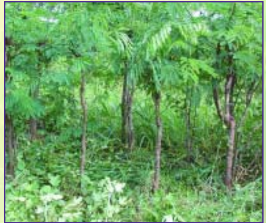
Ejemplo de banco protéico de leucaena.