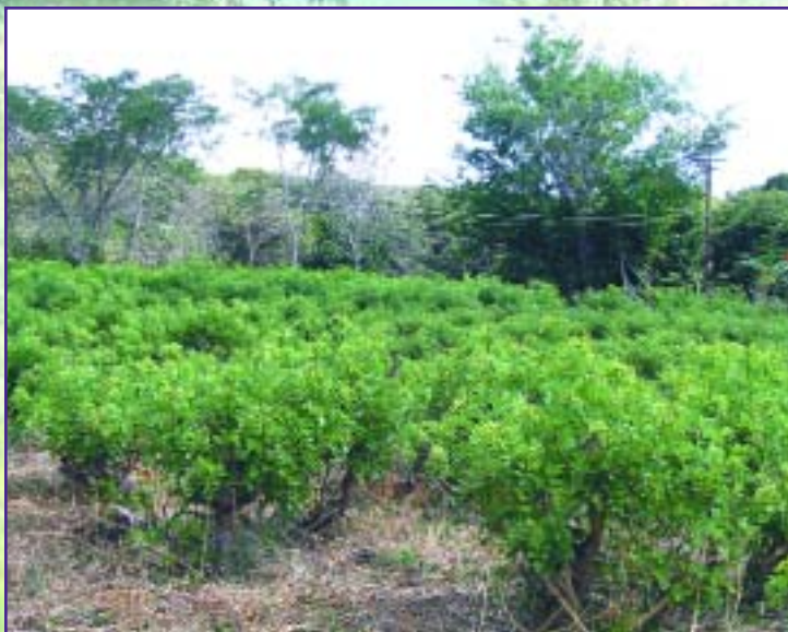
El madero negro se adapta a una amplia gama de suelos.

El madero negro ( Gliricidia sepium ) se adapta bien a una amplia gama de suelos, desde secos a húmedos, incluyendo suelos compactados, ligeramente arenosos, calcáreos y con presencia de piedras.