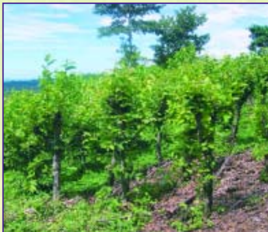
Ejemplo de banco protéico de guácimo.