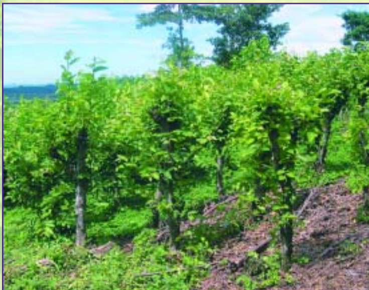
El guácimo crece bien en suelos aluviales y arcillosos de tierras bajas.

El madero negro ( Gliricidia sepium ) se adapta bien a una amplia gama de suelos, desde secos a húmedos, incluyendo suelos compactados, ligeramente arenosos, calcáreos y con presencia de piedras.