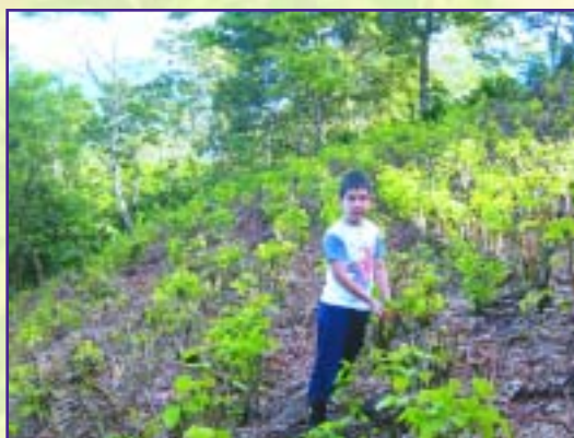
Campo de Cratylia argentea después de la poda.